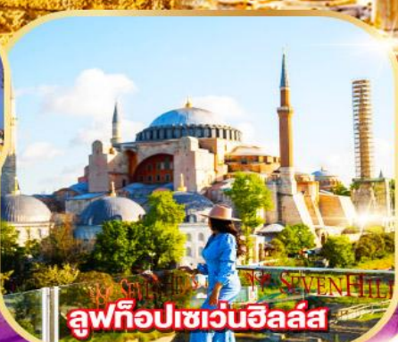
ลูฟท็อปเซเวนฮิลล์