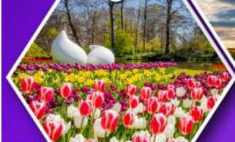
เทศกาลดอกไม้เคอเคนฮอฟ