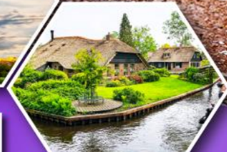
หมู่บ้านกังหัน