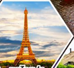
หอคอยไอเฟล