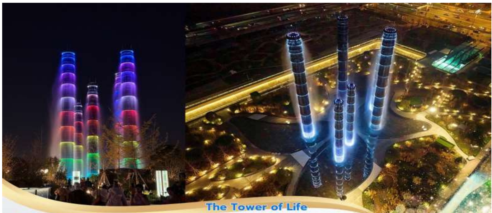
The Tower of Life

เช้า บริการอาหารเช้า ณ ห้องอาหารของโรงแรม นำท่านเดินทางสู่ สถานีรถไฟงามเย่ 09.09 น. นำท่านขึ้นรถไฟความเร็วสูง ขบวนที่ D2682 สู่เมืองซีหนิง ใช้เวลาเดินทางประมาณ 2 ชั่วโมง 15 นาที หมายเหตุ ตัวโดยสารของขบวนรถไฟของแต่ละคณะอาจปรับเปลี่ยนตามขบวนรถที่จองได้จริง ทั้งนี้ขึ้นอยู่กับความซ้ำเร็วในการจองตั๋วของลูกทัวร์ในแต่ละคณะและจำนวนที่ว่างของแต่ละขบวนรถไฟเป็นสำคัญ 11.24 น. คณะเดินทางถึงสถานีรถไฟเมืองซีหนิงจากนั้นนำท่านเดินทางสู่สนามบินซีหนิงเพื่อเดินทางกลับสู่เจิงตุ เที่ยง บริการอาหารกลางวัน ณ ภัตตาคาร หรือ แบบ SET BOX บุนรถไฟ 16.35 น. บินลัดฟ้าสู่ เมืองเจิงตุ โดยสายการบิน เสฉวนแอร์ไลน์ (Sichuan Airlines) เที่ยวบินที่ 3U6344 ใช้เวลาเดินทาง 1 ชั่วโมง 50 นาที มีบริการอาหารว่างและเครื่องดื่ม บนเครื่อง