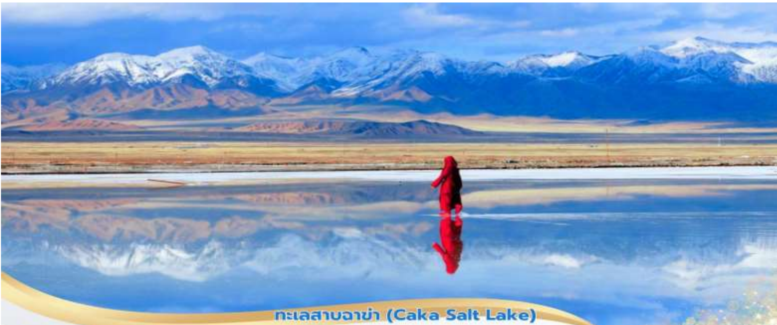
ทะเลสาบจาค่า (Caka Salt Lake)

พิเศษ... นั่งรถไฟเล็กชมวิวทะเลสาบ ชมความงามทะเลสาบปกคลุมด้วยคริสตัลเกลือสีขาวบริสุทธิ์ ในบางจุดยังสามารถเดินบนพื้นเกลือที่แข็งตัวได้อีกด้วย