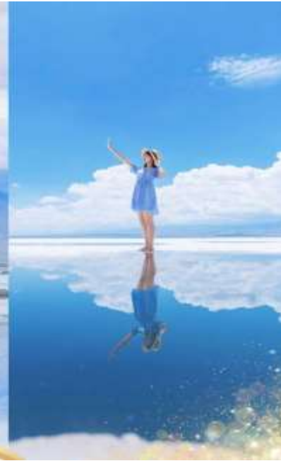
ทะเลสาบจาค่า (Caka Salt Lake)

พิเศษ... นั่งรถไฟเล็กชมวิวทะเลสาบ ชมความงามทะเลสาบปกคลุมด้วยคริสตัลเกลือสีขาวบริสุทธิ์ ในบางจุดยังสามารถเดินบนพื้นเกลือที่แข็งตัวได้อีกด้วย