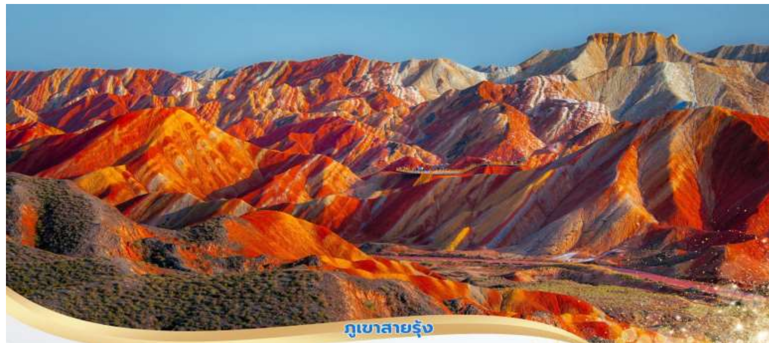
ภูเขาสายรุ้ง

บ่าย นำท่านเที่ยวชม อุทยานภูเขาสายรุ้ง (รวมรถกอล์ฟ) ในเขตอุทยานมีภูเขาหินทรายสีแดงที่เกิดจากการเคลื่อนตัวของเปลือกโลกที่กินเวลานานหลายร้อยล้านปี จนกลายเป็นลักษณะภูมิประเทศที่มีรูปลักษณะแปลกประหลาดและสีสันหลากหลายสายรุ้ง เป็นประติมากรรมทางธรรมชาติที่ยิ่งใหญ่ สวยงามเหนือคำบรรยาย พื้นที่อุทยานครอบคลุมพื้นที่ราว 300 ตารางกิโลเมตร ประกอบด้วยภูเขาหินทรายสีแดงสด และสีแดงน้ำตาล ที่มีระดับความเข้มของสีที่แตกต่างกันนับพันยอด นำท่านนั่งรถกอล์ฟของอุทยานแวะเที่ยวตามจุดชมวิวที่เป็นไฮไลท์สำคัญต่างๆ ในอุทยาน โดยในจุดชมวิวทุกจุดจะมีทางบันไดขึ้น ลงและระเบียงทางเดินเพื่อให้นักท่องเที่ยวสามารถเดินชม และถ่ายภาพได้อย่างสะดวก ปลอดภัย