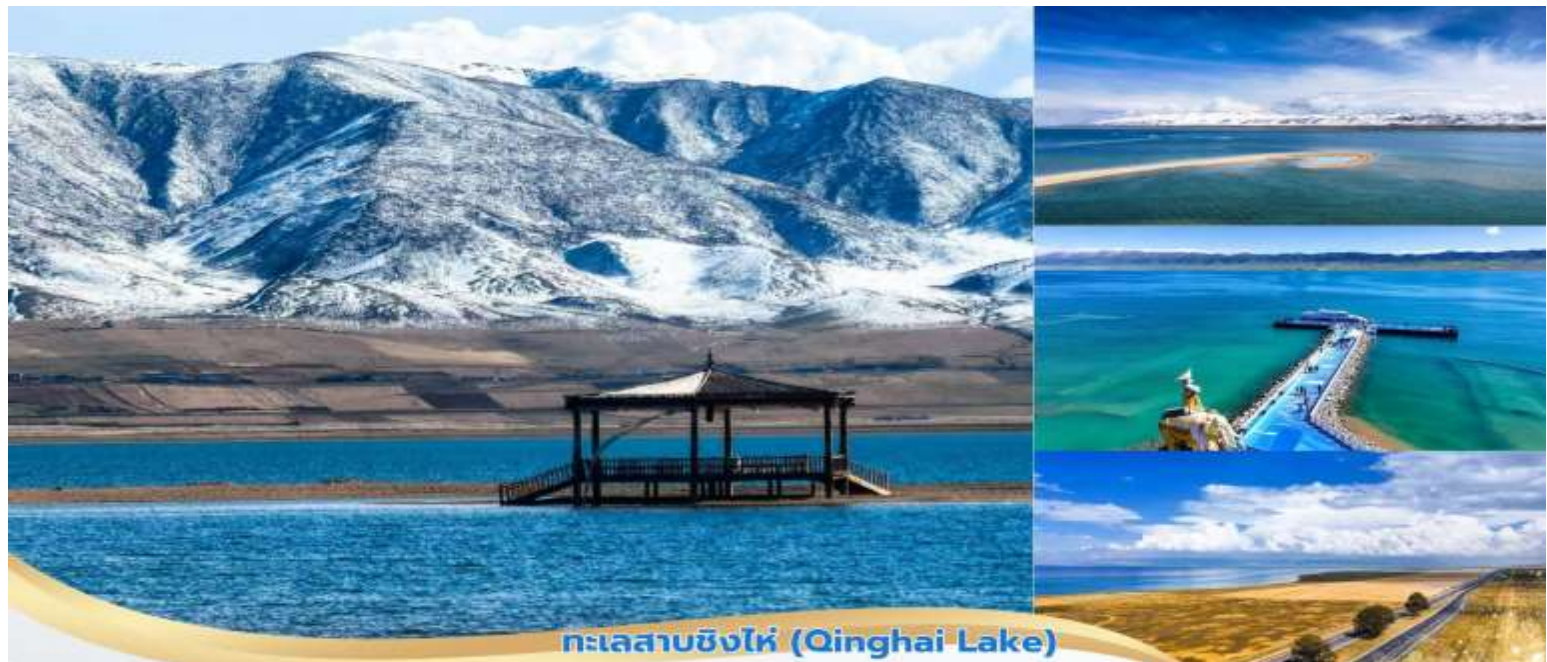
ทะเลสาบชิงไห่ (Qinghai Lake)

บ่าย นำท่านเดินทางต่อสู่ ทะเลสาบชิงไห่ (Qinghai Lake, 青海湖) เป็นทะเลสาบน้ำเค็มที่ใหญ่ที่สุดในประเทศจีน ตั้งอยู่ในมณฑลชิงไห่ (Qinghai) ท่ามกลางเทือกเขาชิงไห่-ทิเบต มีความสวยงามโดดเด่นด้วยน้ำสีครามเข้ม ตัดกับท้องฟ้าและภูเขาหิมะทะเลสาบแห่งนี้มีความงดงามตามธรรมชาติและมีความสำคัญทางวัฒนธรรม ทำให้เป็นหนึ่งในจุดหมายปลายทางยอดนิยมของนักท่องเที่ยว