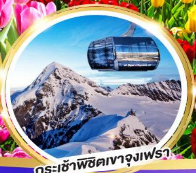
กระเช้าพิชิตยอดเขาจุงเฟรา