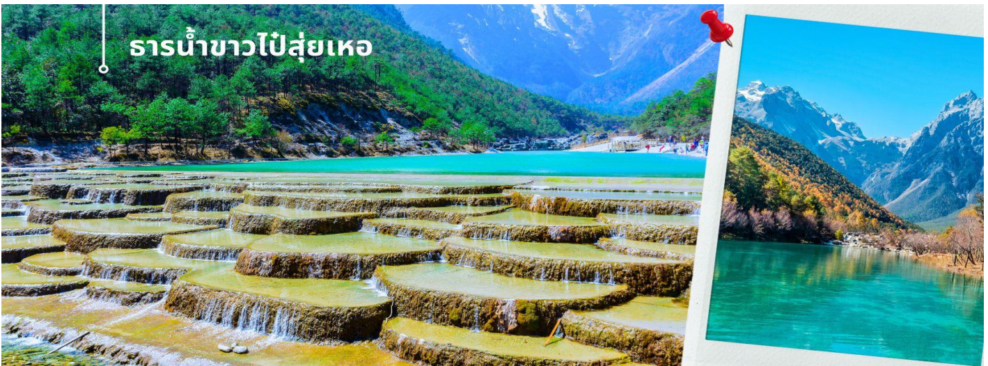
ธารน้ำขาวไป๋ส่วยเหอ

นำท่านชม ธารน้ำขาวไป๋ส่วยเหอ หรือ ทะเลสาบไป๋ส่วยเหอ (รวมค่าบริการรถแบดเตอร์) ทะเลสาบสีเทอร์ควอยซ์ตัดกับวิวต้นไม้ท่ามกลางขุนเขาแห่งหุบเขาพระจันทร์สีน้ำเงิน ฉากของภูเขาหิมะมังกรหยก มีน้ำตกหินปูนชั้นบันไดขนาดเล็กลดหลั่นลงมาอย่างสวยงาม น้ำที่ไหลผ่านหุบเขานี้คือน้ำที่ละลายจากหิมะบนยอดเขาหิมะมังกรหยก เนื่องจากจุดนี้มีทิวทัศน์ที่สวยงามมีฉากหลังคือภูเขาหิมะมังกรหยกมีน้ำตกและแม่น้ำกึ่งทะเลสาบจึงเป็นที่นิยมของนักท่องเที่ยวและคู่รักเป็นอย่างมาก อิสระเก็บภาพประทับใจตามอัธยาศัย