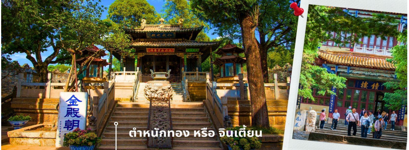
ต้าหนักทอง หรือ จินเตี้ยน

นำท่านเยี่ยมชม ต้าหนักทอง หรือ จินเตี้ยน (The Golden Temple Park | Jindian park) (ไม่รวมค่ารถแบดเตอร์ 10 หยวน/ท่าน) โบราณสถานสำคัญของมณฑลยูนนาน ที่ได้รับการปกป้องดูแลโดยรัฐบาลจีน ตั้งอยู่บริเวณเชิงเขาหมิงเฟิง ล้อมรอบด้วยแนวกำแพงและหอคอยเหมือนเป็นป้อมปราการ ต้าหนักทองถูกเรียกตามลักษณะอาคารที่มีสีทองอร่าม จากทองเหลืองในส่วนของผนังและหลังคา รวมกว่า 200 ตัน โดยถือเป็นสิ่งปลูกสร้างสัมฤทธิ์ที่ใหญ่ที่สุดของจีน ภายในมีรูปปั้นทองโดยมีเงินอยู่ (เสวียนอู่) เทพเจ้าลัทธิเต๋าเป็นองค์ประธาน