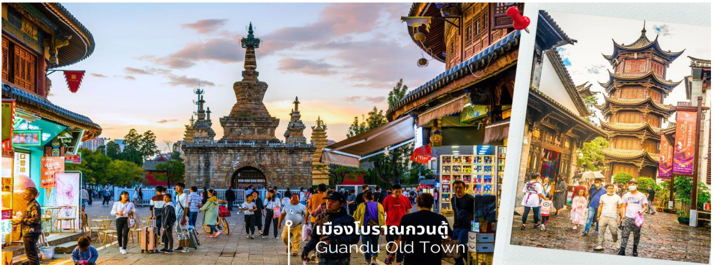
เมืองโบราณกวนตุ๋ Guandu Old Town

เที่ยง 📍 รับประทานอาหารกลางวันที่ภัตตาคาร (16) นำท่านชมบรรยากาศ เมืองโบราณกวนตุ๋ (Guandu Old Town) เป็นหนึ่งในต้นกำเนิดของวัฒนธรรมยูนนาน และยังถือเป็นหนึ่งในภูมิทัศน์ทางประวัติศาสตร์และวัฒนธรรม ที่สำคัญของเมืองคุนหมิง เมืองโบราณแห่งนี้ยังคงเป็นศูนย์กลางทางการค้าและคมนาคมที่สำคัญ ในอดีตเคยเป็นหมู่บ้านชาวประมงในสมัยราชวงศ์ถัง เมืองกวนตุ๋ยังเป็นเมืองแรกๆ ที่ศาสนาพุทธในทิเบตได้เริ่มเผยแพร่เข้ามาในดินแดนยูนนาน