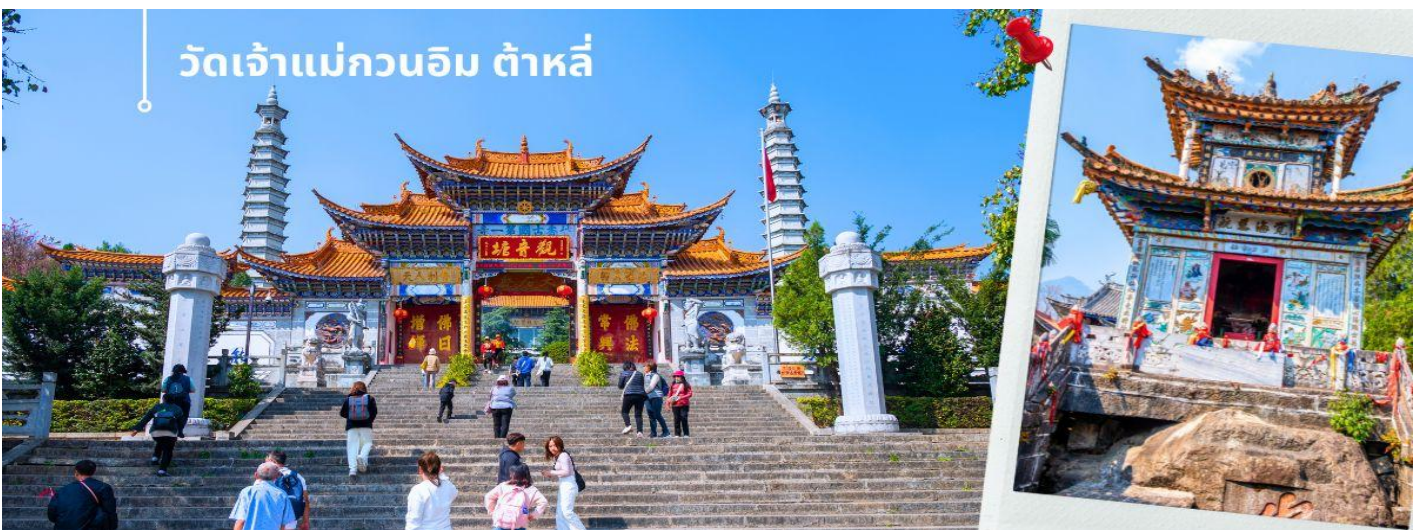
วัดเจ้าแม่กวนอิม ต้าหลี่

นำท่านชม วัดเจ้าแม่กวนอิม (ใช้เวลาเดินทาง 30 นาที) ตามตำนานเล่าว่าเจ้าแม่กวนอิมได้แปลงกายเป็นหญิงชราแบกก้อนหินใหญ่ไว้บนหลังเพื่อให้ทหารของฝ่ายตรงข้ามได้เห็นเมื่อทหารฝ่ายศัตรูได้เห็นว่าแม่แต่หญิงชรายังแข็งแรงถึงเพียงนี้ ถ้าเป็นคนวัยหนุ่มสาวจะต้องมีพลังกำลังมากมายยากที่จะต่อสู้ จึงทำให้ไม่ทำการเข้าโจมตี เมืองและถอยทัพกลับไป ชาวเมืองจึงสร้างวัดแห่งนี้ขึ้นในสมัยราชวงศ์ถัง ซึ่งถือว่าเป็นวัดที่มีประติมากรรมยอดเยี่ยมแห่งหนึ่งในต้าหลี่ จากนั้นผ่านชม เจดีย์สามองค์ สัญลักษณ์ของเมืองต้าหลี่ ตั้งอยู่ภายใน วัดฉงเซียง (Chongsheng Temple) วัดเก่าแก่ที่สร้างขึ้นเมื่อศตวรรษที่ 9 นับว่าเป็นหนึ่งในเจดีย์ที่สูงที่สุดในประเทศจีน