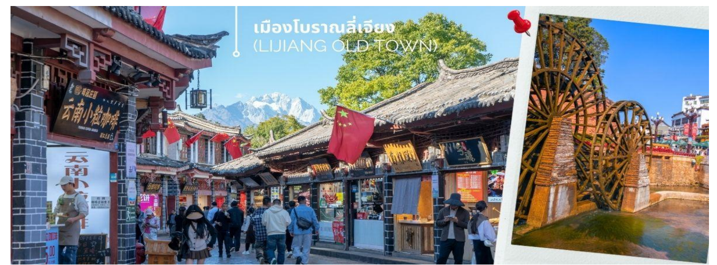
เมืองโบราณลี่เจียง (LIJIANG OLD TOWN)

จากนั้นชม สระมังกรดำ (Heilongtan, Black Dragon Pool) หรือเฮยหลงตัน อยู่ในสวนสาธารณะขนาดใหญ่ เรียกกันว่า สวนยู่ววน ตั้งอยู่ในตัวเมืองลี่เจียง ห่างจากตัวเมืองเก่าลี่เจียงประมาณ 1 กิโลเมตร นำท่านเดินทางชม เมืองเมืองโบราณลี่เจียง (LIJIANG OLD TOWN) หรือ เมืองโบราณต้าเอี้ยนเจิ้น เมืองเก่าแก่อายุกว่า 800 ปี ซึ่งภายในเมืองเก่านี้ยังคงมีสถาปัตยกรรมบ้านเรือนสไตล์จีนเก่าแก่ที่หาชมได้ยาก และได้รับการอนุรักษ์ไว้เป็นอย่างดี บางหลังเหมือนโรงเตี๊ยมโบราณที่เคยเห็นตามหนังสือย้อนยุค บ้านเรือนส่วนใหญ่ถูกปรับเปลี่ยนให้กลายเป็น