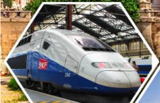
รถไฟด่วน TGV