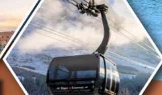
กระเช้าขึ้นสู่ ยอดเขาจุงเฟรา

พิเศษ!! ล่องเรือคอนโดล่าบนเกาะเวนิส ราคาเริ่มต้น