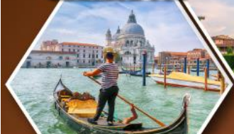
ล่องเรือคอนโดล่า บนเกาะเวนิส