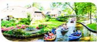
ล่องเรือชมหมู่บ้านทีโรน