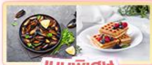
เมนูพิเศษ หอยมัสเชล+วอฟเฟิล

พิซซ่า!! ล่องเรือแม่น้ำแซน ชมเมือง โดย บาโต มูช