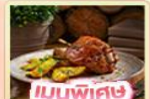
เมนูพิเศษ ขาหมูเยอรมัน