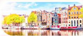
คลองอัมสเตอร์ดัม