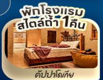
พักโรงแรม สไตล์ดี 1 คืน