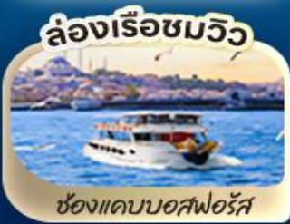
ช่องแคบบอสฟอรัส