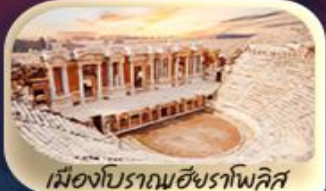
เมืองโบราณฮิยราโพลิส