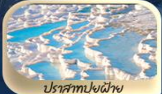
ปราสาทปุยฝ้าย