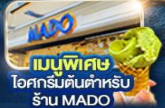
เมนูพิเศษ ไอศกรีมต้นตำหรับ ร้าน MADO