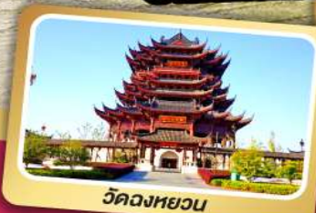
วัดฉงหยวน