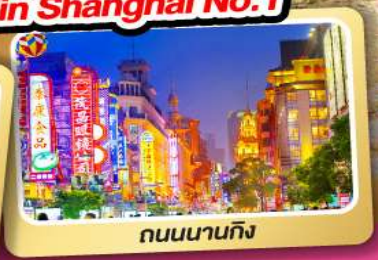
ถนนนานกิง