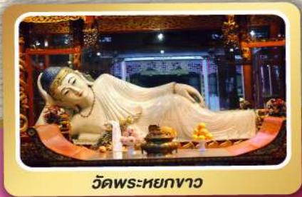
วัดพระหยกขาว

พิเศษ ทานบะหมี่ปู ร้าน Michelin Shanghai No.1