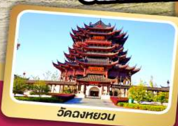
วัดฉงหยวน