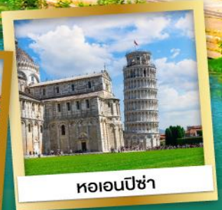
หออนปีซ่า