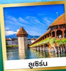
ลูซิิร์น