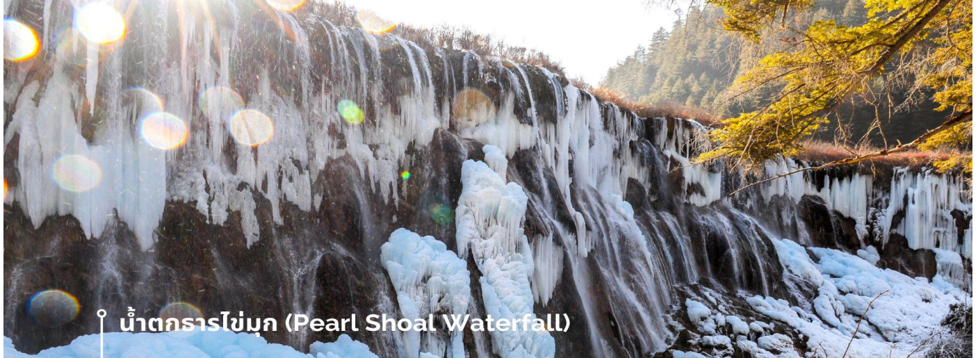
น้ำตกธารไข่มุก (Pearl Shoal Waterfall)

จากแสงแดดที่สะท้อนกับละอองน้ำอีกด้วย หากได้มาในช่วงฤดูหนาว ก็จะได้เห็นหิมะเกาะตามต้นไม้ โขดหิน และถ้าอากาศหนาวมากๆ น้ำที่น้ำตกก็จะกลายเป็นน้ำแข็ง กลายเป็นประติมากรรมจากธรรมชาติที่สวยงาม