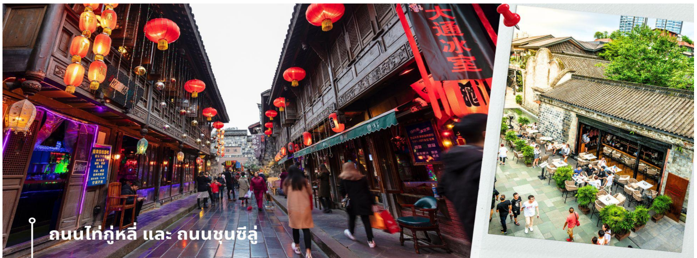
ถนนไท่กุ่หลี่ และ ถนนชุนซีลู่

จากนั้นให้ท่านให้อิสระกับการเลือกซื้อสินค้าของฝากที่ ถนนไท่กุ่หลี่ และ ถนนชุนซีลู่ ในย่านนี้เป็นถนนโบราณ ในอดีตเคยโรงงานผลิตผ้าไหมใหญ่ที่สุดในจีน ปัจจุบันได้เปลี่ยนเป็นถนนช้อปปิ้งแหล่งสวรรค์ของนักท่องเที่ยว เป็นถนนคนเดิน มีห้างสรรพสินค้าชื่อดัง มีร้านค้ามากกว่า 700 ร้านค้าที่เต็มไปด้วยสินค้าต่าง ๆ ทั้งร้านค้าแฟชั่น ร้านอาหารและโรงแรมนานาชาติมากมายซึ่งเป็นที่เที่ยวเฉิงตูที่มีการเชื่อมต่อทางวัฒนธรรมท้องถิ่นที่เป็นแหล่งช้อปปิ้งและเป็นแหล่งร้านอาหารที่อร่อยต่าง ๆ มากมาย ซึ่งเป็นสถานที่ที่เที่ยวของเฉิงตูที่ทำให้เพลิดเพลินกับสินค้าแบรนด์เนมและแบรนด์จีน