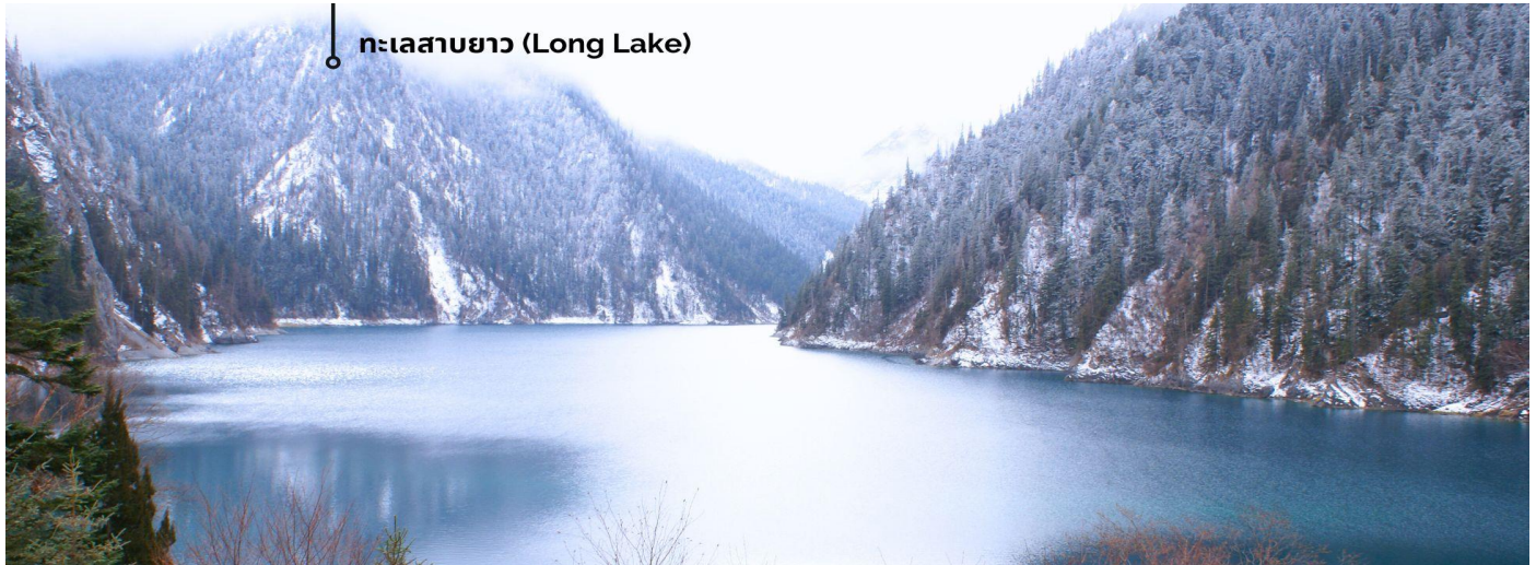
ทะเลสาบยาว (Long Lake)

ทะเลสาบที่ใหญ่ที่สุด สูงที่สุด และลึกที่สุดในจิวจ้ายโกว ด้วยเนื้อที่กว่า 581 ไร่ ความยาวกว่า 7 กิโลเมตร และลึกถึง 103 เมตร ทอดตัวโค้งเป็นรูปพระจันทร์เสี้ยว เนื่องจากหิมะบนภูเขาละลายลงมา น้ำในทะเลสาบสีฟ้าสวยงาม ล้อมรอบด้วยยอดเขาสูงชัน และต้นไม้ใหญ่ที่ปกคลุมด้วยหิมะ งดงามราวหลุดออกมาจากภาพวาด ความพิเศษในช่วงฤดูหนาว ทะเลสาบจะกลายเป็นน้ำแข็งหนากว่า 60 เซนติเมตร ทำให้นักท่องเที่ยวนิยมมาเล่นสเก็ตน้ำแข็งกันเป็นจำนวนมาก