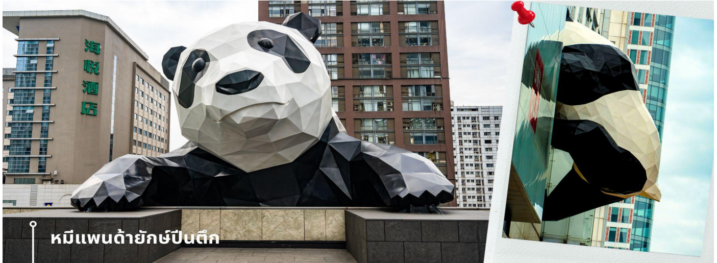
หมีแพนด้ายักษ์ป็นตึก

ป็นตึก และมีส่วนหัวที่โผล่พ้นออกมาจากอาคาร ทำให้เกิดภาพอันน่ารักและน่าประทับใจจากผู้ที่ได้พบเห็นและนักท่องเที่ยว