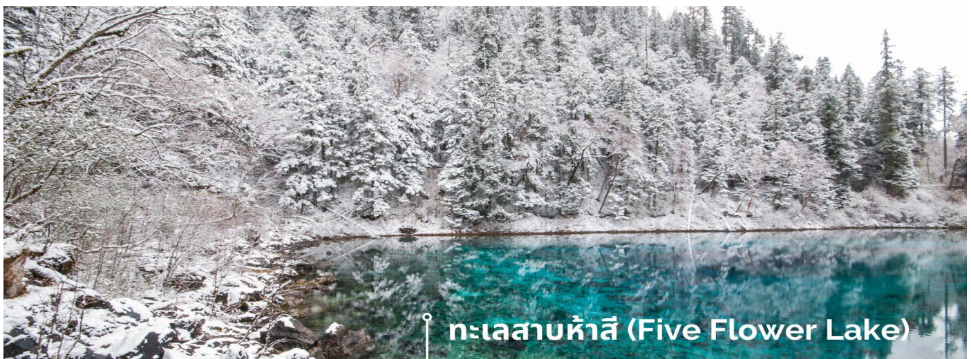
ทะเลสาบห้าสี (Five Flower Lake)

หนึ่งในจุดที่สวยงามและนักท่องเที่ยวแวะมาเยี่ยมชมเยอะที่สุด ตั้งอยู่ที่ความสูงเหนือระดับน้ำทะเลประมาณ 2,472 เมตร น้ำลึกประมาณ 5 เมตร น้ำใสจนเห็นพื้นด้านล่างของทะเลสาบ สีของผิวน้ำสวยงามแปลกตา โดยเฉพาะเมื่อยามแสงอาทิตย์สาดส่องกระทบผิวน้ำ สีของน้ำในทะเลสาบจะสะท้อนเป็นสีส้มถึง 5 เฉดสี สวยงามสะกดตา ซึ่งสาเหตุที่ทำให้เกิดสีส้มต่างๆ นี้มาจากการสะสมของแร่ธาตุ และพีชน้ำชนิดต่างๆ โดยจะมีสีส้มแตกต่างกันไปตามฤดูกาลและช่วงเวลา ยิ่งถ้ามาในช่วงฤดูหนาว ต้นไม้ริมทะเลสาบจะเต็มไปด้วยหิมะสีขาวตัดกับสีของทะเลสาบ ดูสวยงามแปลกตา