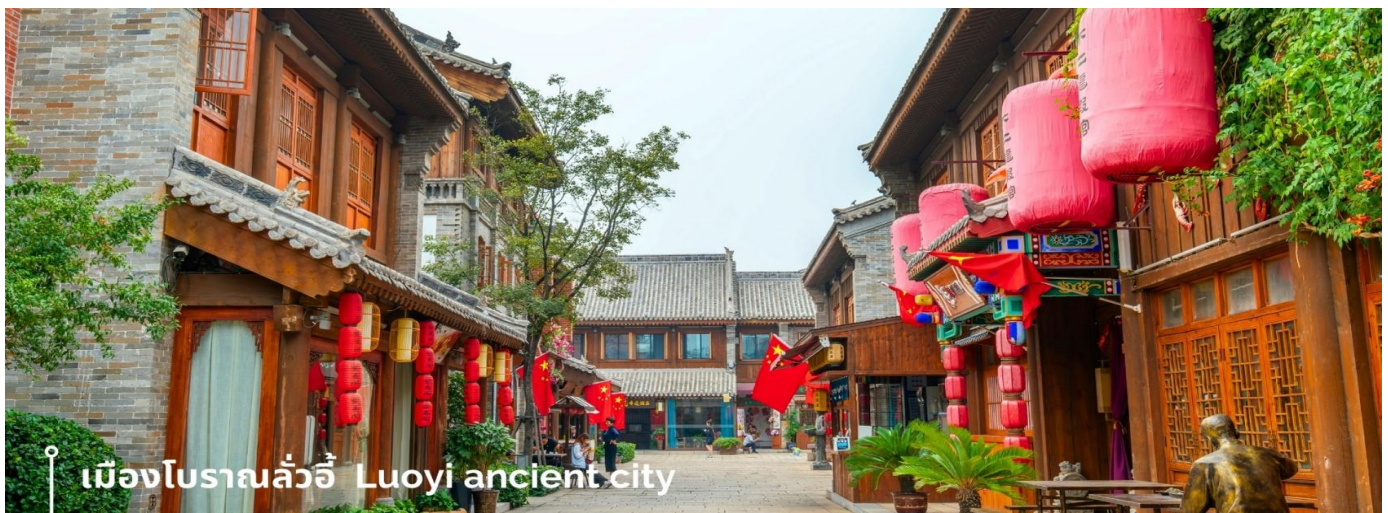
เมืองโบราณลั่วอู Luoyi ancient city

นำท่านเที่ยวชม เมืองโบราณลั่วอู เป็นสถานที่ท่องเที่ยวระดับ 1A ตั้งอยู่ในเมืองเก่าของเมืองลั่วหยาง เมืองหลวงโบราณของราชวงศ์ทั้ง 13 ราชวงศ์ บรรยากาศคอบอวลไปด้วยเสน่ห์แบบจีนโบราณ ที่ยังคงอยู่มายาวนานหลายร้อยปี เมื่อเดินเล่นผ่านเมืองโบราณลั่วอู จะเห็นสถาปัตยกรรมบ้านเรือน ที่มีชายคาซ้อนกันเป็นชั้นๆ และกำแพงเมือง สนามหญ้าโบราณ ให้ทุกท่านรู้สึกราวกับหลุดเข้าไปในยุคจีน โบราณ