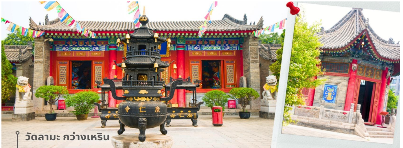
วัดลามะ กว่างเหริน

CZHYCU1 ชีอาน ลั่วหยาง วัดเส้าหลิน สุสานจินซี วัดลามะ 6วัน 5คืน ZH เชนเจิ้นแอร์ไลน์