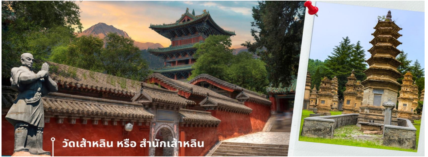
วัดเส้าหลิน หรือ สำนักเส้าหลิน

ของนักแสดง ซึ่งทุกคนล้วนถูกฝึกปรืออย่างหนัก กว่าที่จะออกมาเป็นโชว์สุดยอดวิชา จนถึงขั้นที่ว่ากังฟูของสำนักเส้าหลิน ได้รับการยกย่องให้เป็นมรดกทางวัฒนธรรมที่จับต้องไม่ได้ของจีน