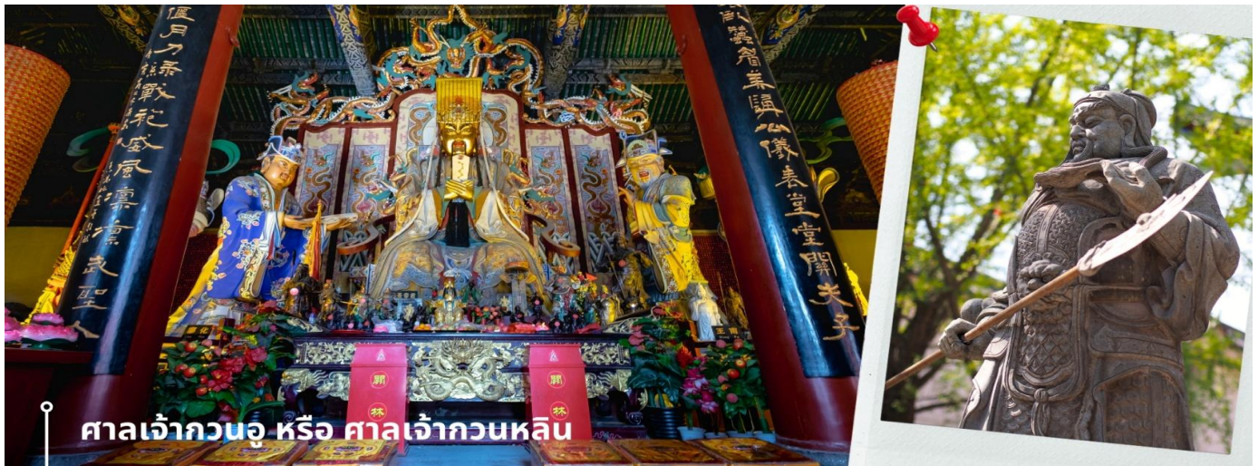
ศาลเจ้ากวนอู หรือ ศาลเจ้ากวนหลิน

CZHYCU1 ชื่อาน ลั่วหยาง วัดเส้าหลิน สุสานจินซี วัดลามะ 6วัน 5คืน ZH เชนเงินแอร์ไลน์