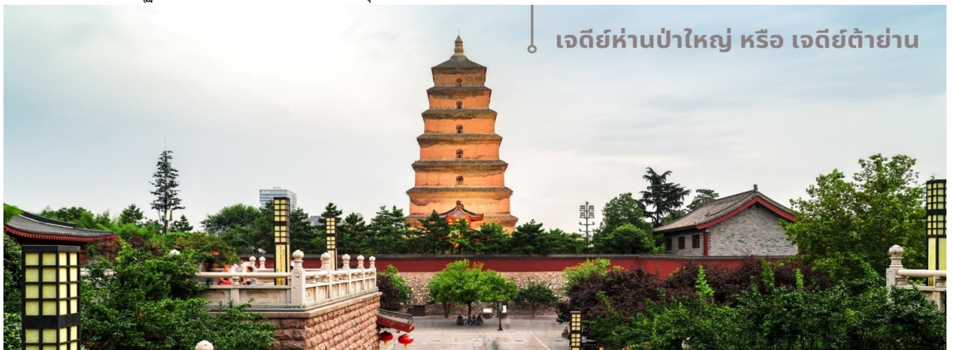
เจดีย์ห่านป่าใหญ่ หรือ เจดีย์ต้ายาน

จากนั้นนำท่านเที่ยวชม เจดีย์ห่านป่าใหญ่ หรือ เจดีย์ต้ายาน สถานที่ท่องเที่ยวระดับ 4A อายุมากกว่า 1,300 ปี ตั้งอยู่ในบริเวณวัดต้าฉือเอิน ซึ่งเป็นวัดสำคัญที่พระถังซำจั๋งเคยพำนัก ในตอนใต้ของเมืองซีอาน มณฑลฉ่านซี ตัวเจดีย์สร้างขึ้นใน ค.ศ.652 ในสมัยราชวงศ์ถัง โดยพระถังซำจั๋ง(หรือพระเสวียนจ่าง) ได้เสนอให้สร้างขึ้นเพื่อเก็บพระคัมภีร์และวัตถุที่ได้นำกลับมาจากชมพูทวีปในช่วงการเดินทางไปแสวงบุญที่อินเดีย เจดีย์ห่านป่าใหญ่มีความสูงประมาณ 64 เมตรในปัจจุบัน หลังผ่านการบูรณะและปรับปรุงหลายครั้ง โครงสร้างของเจดีย์ทำจากอิฐและมีการออกแบบที่เรียบง่ายแต่สง่างาม แสดงถึงสถาปัตยกรรมสมัยราชวงศ์ถัง แต่ด้วยเหตุแผ่นดินไหวในเวลาต่อมา บางส่วนของเจดีย์ถล่มลง ทำให้ปัจจุบันเหลือเพียง 7 ชั้นเท่านั้น ส่วนที่มาของชื่อเจดีย์ ตำนานเล่าว่ามีพระสงฆ์ในกลุ่มหนึ่งที่นับถือลัทธิแบบมหายาน เคยขาดแคลนอาหารอย่างหนัก วันหนึ่งพระสงฆ์เห็นฝูงห่านป่าบินผ่าน สงฆ์บางคนอธิษฐานต่อพระพุทธเจ้าให้พวกเขาได้รับอาหารเพียงพอสำหรับดำรงชีวิต ทันใดนั้น ห่านป่าตัวหนึ่งตกลงมาจากท้องฟ้าชนเข้ากับเจดีย์ ถึงแก่ความตาย เหล่าพระสงฆ์เชื่อว่าเป็นการสละร่างให้เป็นอาหาร จึงเชื่อกันว่าห่านตัวนั้นคือสัญลักษณ์ของพระเมตตา บ้างก็ว่าห่านตัวนั้นคือพระโพธิสัตว์ จึงสร้างเจดีย์ขึ้นเพื่อแสดงความขอบคุณและเป็นที่ระลึก เหตุการณ์นี้กลายเป็นที่มาของชื่อ "เจดีย์ห่านป่าใหญ่" เพื่อสะท้อนถึงปฎิหาริย์และความศรัทธาในพระพุทธศาสนา