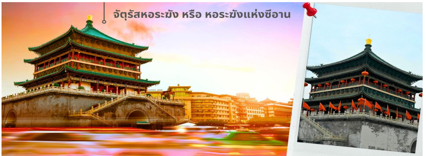
จัตุรัสหอร่มขัง หรือ หอร่มขังแห่งชีอาน

จากนั้นนำท่านเดินทางเที่ยวชม จัตุรัสหอร่มขัง หรือ หอร่มขังแห่งชีอาน เป็นหนึ่งในสัญลักษณ์สำคัญของเมืองชีอาน ตั้งอยู่ใจกลางเมือง สร้างขึ้นในปี ค.ศ. 1384 สมัยราชวงศ์หมิง เพื่อใช้ประกาศเวลาและเตือนภัยจากศัตรู ตัวหอสร้างจากไม้ทั้งหลัง มีความสูงประมาณ 36 เมตร โดดเด่นด้วยสถาปัตยกรรมจีนโบราณที่งดงาม และการประดับด้วยลวดลายสีทองและเขียว จัตุรัสแห่งนี้เป็นจุดตัดของถนนสายหลักทั้งสี่สาย สามารถขึ้นไปชมวิวเมืองชีอานแบบพาโนรามาได้ด้านบน นอกจากนี้ ภายใต้งยังมีพิพิธภัณฑ์เกี่ยวกับประวัติศาสตร์และวัฒนธรรมของหอร่มขังให้ได้ชมอีกด้วย