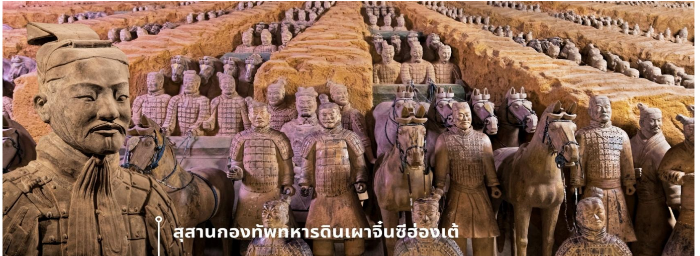
สุสานกองทัพทหารดินเผาจีนซีฮ่องเต้

เผาอีกกว่า 600 ตัว พร้อมรถม้า และอาวุธต่าง ๆ ความน่าทึ่งอีกอย่างก็คือ ทหารดินเผาแต่ละตัวถูกปั้นขึ้นด้วยมือและมีรายละเอียดแตกต่างกันไป เช่น สีหน้า ทรงผม และเครื่องแต่งกาย ซึ่งสะท้อนยศและบทบาทของแต่ละคนในกองทัพ รวมถึงการเคลือบสีเพื่อให้รูปปั้นคงทนยาวนาน ซึ่งในปัจจุบัน สุสานแห่งนี้มีขนาดใหญ่ พื้นที่มากกว่า 56 ตารางกิโลเมตร ยังมีหลุมฝังศพหลัก และหลุมย่อยอีกมากมายที่ยังไม่ได้ถูกขุดค้น