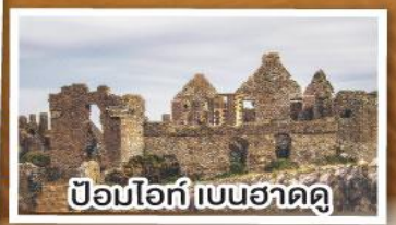
ป้อมโอท์ เบนฮาดดู