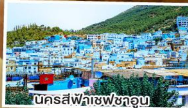
นครสีฟ้าชفشวอูน