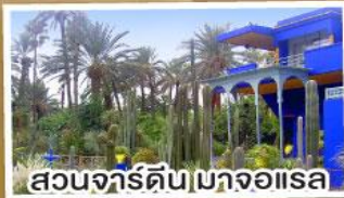
สวนจาร์ดิน มาจอแอส