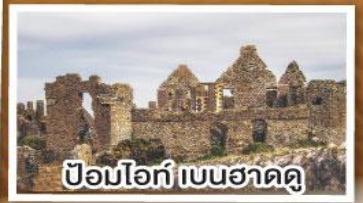
ป้อมโอ๊ก เบนฮาดดู