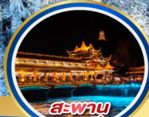
สะพาน หนานเจียว