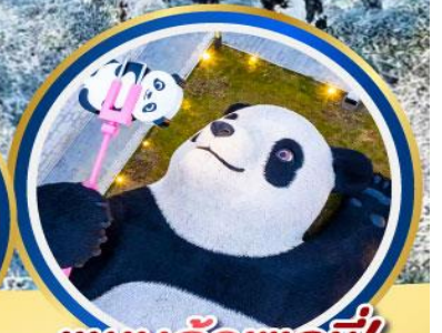
แพนด้าเซลฟี