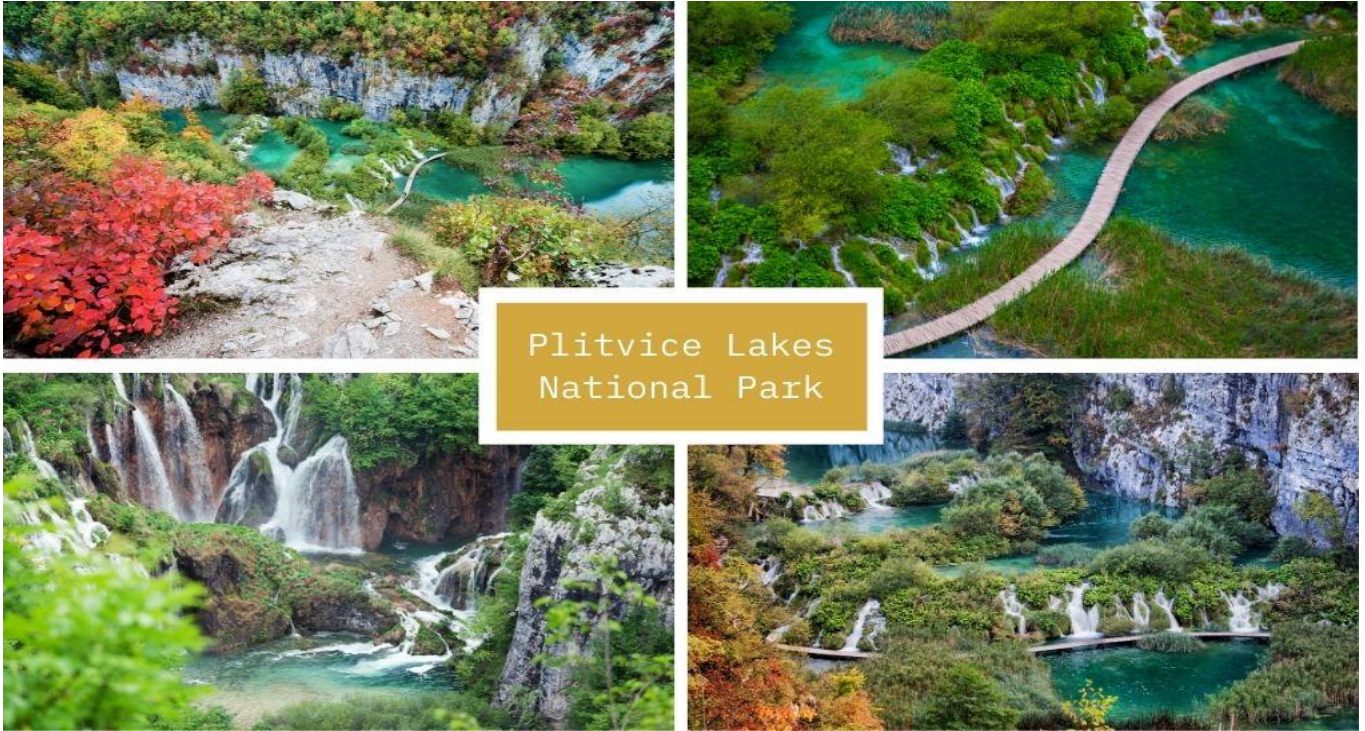
Plitvice Lakes National Park