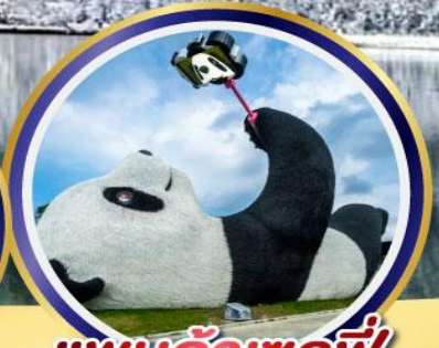
แพนด้าเซลฟี่