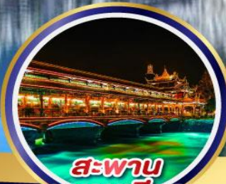
สะพาน หนานเจียว