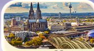
มาสทริชต์