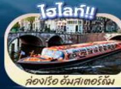
ล่องเรือ อัมสเตอร์ดัม

"ตำนานเด็กยีนส์ สัญลักษณ์แห่งกรุงบรัสเซลส์ แมนเนเกน พิส มหาวิหารโคโลญ" สะพานไฮอินชอลเลิร์น ล่องเรือชมหมู่บ้านที่โรริน กังหันลมชานส์คันทัส คลองอัมสเตอร์ดัม บรัสเซลส์ อะโตเดียม จัตุรัสรูจส์ หอไอเฟล จัตุรัสคองคอร์ด พิพิธภัณฑ์ลูฟร์ ล่องเรือแม่น้ำเซน ซ็อบบิงแบบจตุใจที่ห้างชั้นนำ