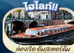
ล่องเรือ อัมสเตอร์ดัม

"ตำนานเด็กยีนส์ สัญลักษณ์แห่งกรุงบรัสเซลส์ แมนเนเกน พิส มหาวิหารโคโลญ" สะพานไฮอินชอลเลิร์น ล่องเรือชมหมู่บ้านที่โรริน กังหันลมชานส์คันทัส คลองอัมสเตอร์ดัม บรัสเซลส์ อะโตเมียม จัตุรัสมงซูส์ หอไอเฟล จัตุรัสคองคอร์ด พิพิธภัณฑ์ลูฟร์ ล่องเรือแม่น้ำเซน ซุปป์ิงแบบจตุไรท์ที่ห้างชั้นนำ