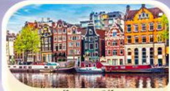
อัมสเตอร์ดัม