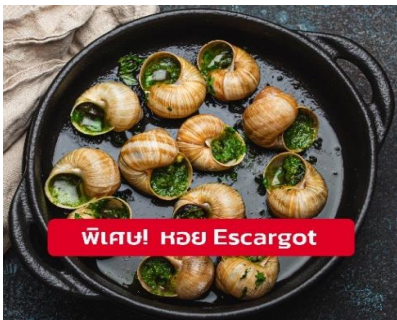
พิเศษ! หอย Escargot

เย็น ๑๐ รับประทานอาหารเย็น (มื้อที่13) เมนูพิเศษ!! หอยเอสคาโก้ (Escargot)