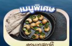
เมนูพิเศษ