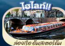
ล่องเรือ อัมสเตอร์ดัม

พิพิธภัณฑ์ลูฟร์ ล่องเรือแม่น้ำเซน ซ็อบบิงแบบจุใจที่ห้างชั้นนำ