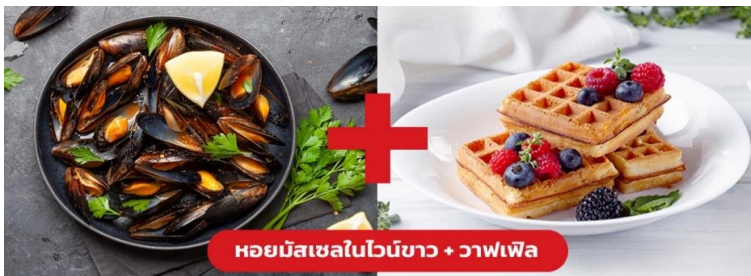
หอยมัสเซลในไวน์ขาว + วาฟเฟิล

เย็น ๑๐ รับประทานอาหารเย็น (มื้อที่10) เมนูพิเศษ!! หอยมัสเซล + วาฟเฟิล (Mussel in White wine + Waffle)