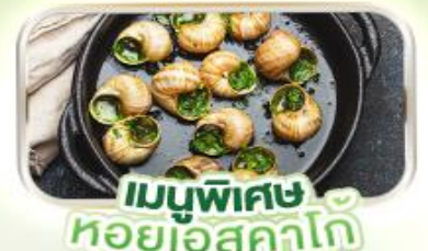
เมนูพิเศษ หอยแอสคาโต้

พิเศษ ล่องเรือแม่น้ำแซนชมเมือง โดย บาโต มูช