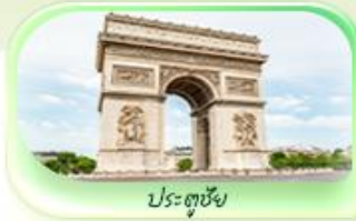
ประตูชัย