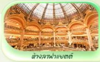
ซังสลาฟายแอสต์