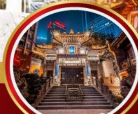
วัดหลิวอัน