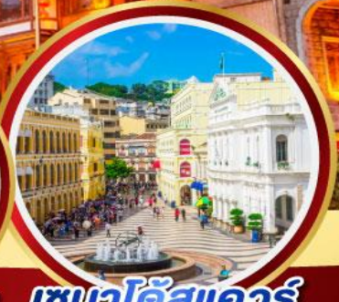
เซนาโต้สแควร์