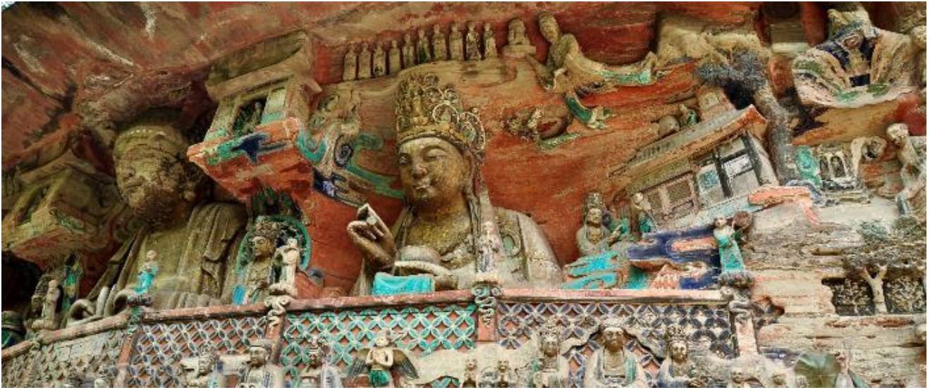
จากนั้นนำท่านเดินทางกลับสู่ นครฉงชิ่ง (ใช้เวลาในการเดินทางประมาณ 2 ชั่วโมง)