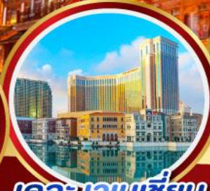
เดอะเวเนเชียน