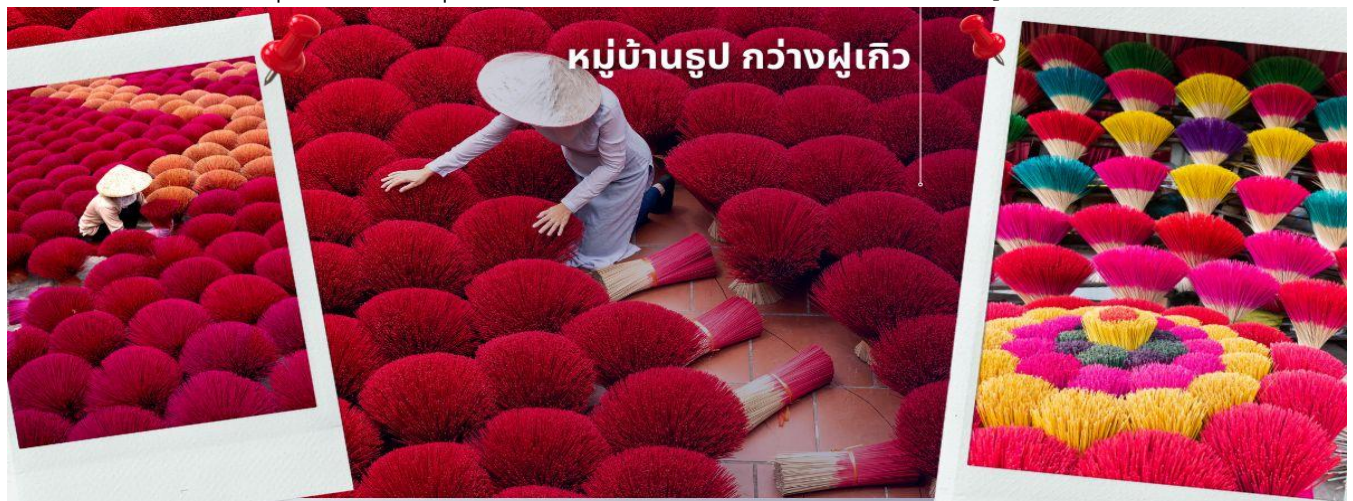
หมู่บ้านรูป กว้างฝูเกิว

จากนั้นนำท่านเดินทางสู่เมืองนิงห์บิ่งห์ และเที่ยวชมวิถีของชาวเวียดนามใน หมู่บ้านรูป หมู่บ้านชุมชนที่เป็นแหล่งผลิตรูปที่ใหญ่ที่สุดแห่งหนึ่งของประเทศเวียดนาม หมู่บ้านกว้างฝูเกิว หมู่บ้านรูป เอกลักษณ์เหมือนทุ่งดอกไม้ใกล้กรุงฮานอย ชาวบ้านที่ส่งต่อ และถ่ายทอดวิธีการทำรูปแบบดั้งเดิม ทั้งการเหลาไม้ไผ่