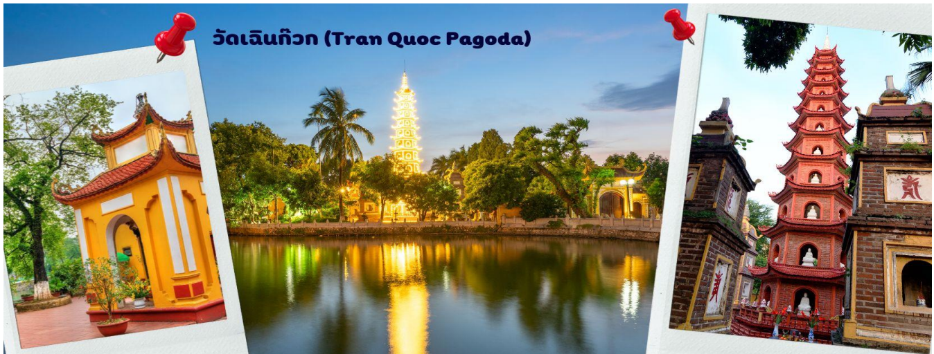
วัดเงินก๊วก (Tran Quoc Pagoda)

จากนั้นนำท่านไป วัดเงินก๊วก (Tran Quoc Pagoda) เป็นวัดที่อยู่ใจกลางเมืองของเวียดนาม ใกล้ชิดกับ ทะเลสาบตะวันตกของเมืองฮานอย สร้างด้วยสถาปัตยกรรมจีนโบราณ มีความร่มรื่น และบรรยากาศดี จึงเป็นที่นิยมของนักท่องเที่ยวทั้งที่ชื่นชมความงามและมีศรัทธาในพระพุทธศาสนา จากภาพมุมสูงของสถานที่ตั้ง ที่นี้เหมือนตั้งอยู่บนเกาะที่ยื่นลงไปทะเลสาบ แต่มีเส้นทางคมนาคมเข้าถึงที่ สิ่งปลูกสร้างมีการวางผังเป็นอย่างดี ใช้สีสันทึกลับกมลกลืนในโทนสีเหลือง น้ำตาล ตัดกับสีเขียวของต้นไม้ใหญ่ที่โอบล้อมอยู่ในมุมถ่ายภาพจากอีกฝั่งหนึ่ง จะเห็นสิ่งปลูกสร้างสไตล์จีน และเจดีย์หลายชั้นโดดเด่น มีภาพที่สะท้อนลงสู่ผืนน้ำ เป็นภูมิทัศน์ที่งดงามทั้งยามกลางวันและยามค่ำคืนที่มีการเปิดไฟส่องสว่าง