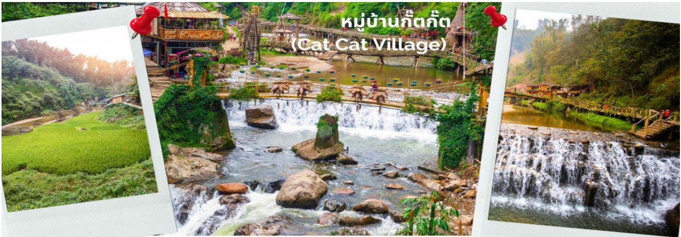
หมู่บ้านก๊ตก๊ต (Cat Cat Village)

CFDH3 สานอย ซาปา สะพานแก้วมังกรเมฆ หนึ่งหิ้งบิงห์ 4 วัน 3 คืน FD (11-14 ม.ค. 68)