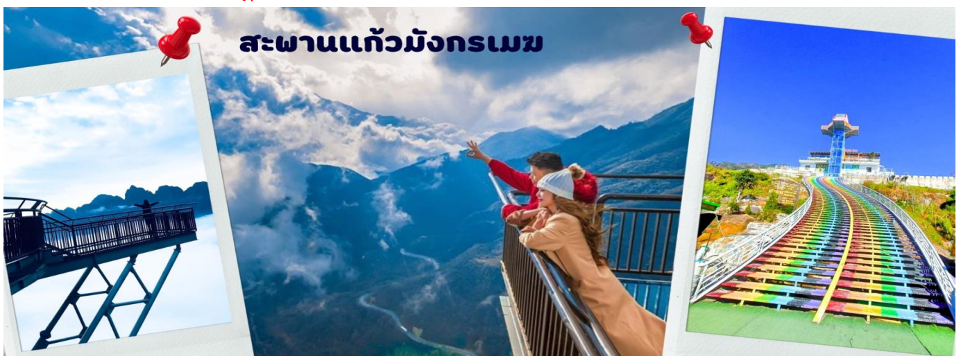
สะพานแก้วมังกรเมฆ

จากนั้นนำท่านไป สะพานแก้วมังกรเมฆ รวมค่าขึ้นสะพานแล้ว ตั้งอยู่ที่ภูมิภาคเวียดนามเหนือ ติดประเทศจีน ที่เมือง "ซาปา" เมืองที่เคยมีหิมะตกที่เคยเป็นข่าวในวงการท่องเที่ยวเมืองหลายปีก่อน สะพานแก้วมังกรเมฆนี้ห่างจากตัวเมืองประมาณ 18 Km กับระดับความสูงจากพื้นด้านล่าง 300 เมตรและสูงจากระดับน้ำทะเลถึง 2,200 เมตร ทางขึ้นจะให้ผู้เข้าชมมาจากทางลิฟต์แก้วขึ้นไปสู่ระเบียงด้านบนและต้องใช้ถุงผ้าใส่หีบรองเท้าอีกทีเพื่อเดินในทางเดินกระจกทอดยาวไปจนถึงระเบียงชมวิวกว้างกับวิว 360 องศาท่ามกลางเมฆหมอกและธรรมชาติป่าเขียวชอุ่มของเมืองซาปา สวยงามเหนือคำบรรยายจริง ๆ (ไม่รวมกิจกรรมอื่น ๆ)