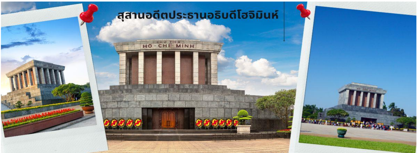
สุสานอดีตประธานาธิบดีโฮจิมินห์

เที่ยง รับประทานอาหารกลางวัน ณ ภัตตาคาร (8)