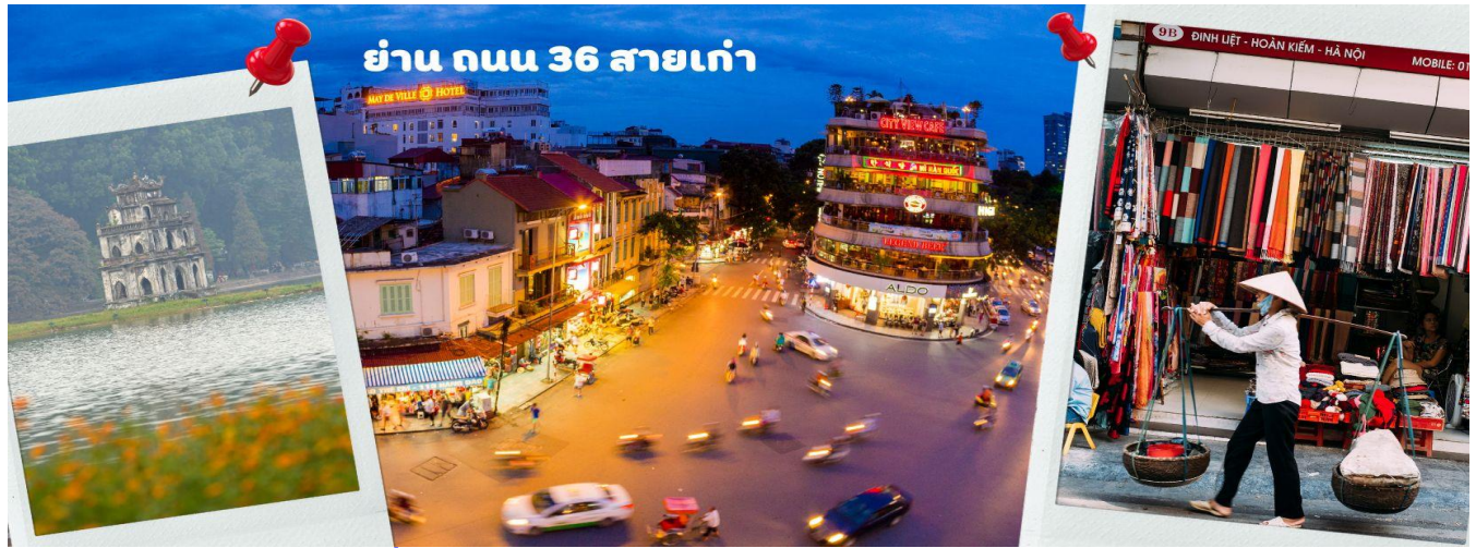
ย่าน ถนน 36 สายเก่า

36 ไปแล้ว ที่นี่จะเป็นแหล่ง Shopping มีสินค้าเกือบทุกชนิด ร้านขายชุดกีฬา มีทุกแบรนด์ เพราะที่นี่เป็นแหล่งผลิตให้หลาย ๆ แรนด์