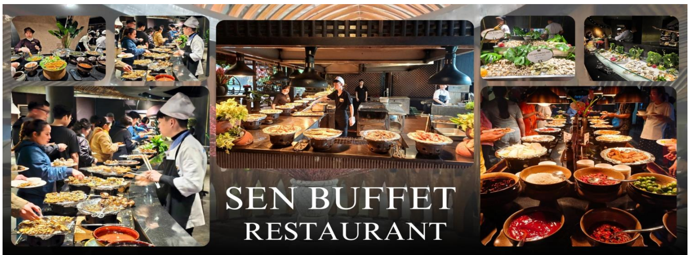
ZEN BUFFET RESTAURANT

ค่ำ รับประทานอาหารค่ำ ณ ภัตตาคาร ZEN BUFFET (9)