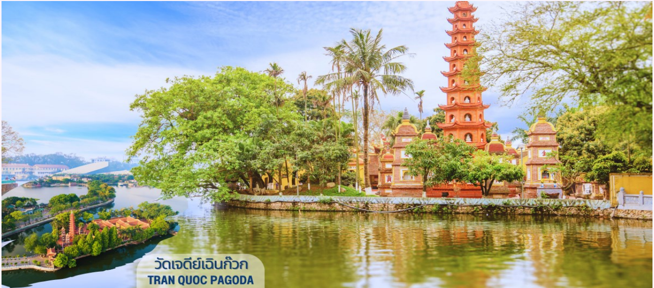
วัดเจดีย์เงินกวาง TRAN QUOC PAGODA

นำท่านถ่ายรูปด้านหน้า สุสานโฮจิมินห์ (HO CHI MINH MAUSOLEUM) ตั้งอยู่ที่จัตุรัสบาสตงห์ เคยเป็นที่ที่ลุงโฮได้อ่านคำประกาศอิสรภาพเวียดนามจากประเทศฝรั่งเศสต่อหน้าชาวเวียดนามที่มาชุมนุมกัน เมื่อวันที่ 02 กันยายน ค.ศ.1945 สุสานนี้สร้างด้วยหินอ่อน หินแกรนิตและไม้มีค่าจากทั่วประเทศ สร้างขึ้นเมื่อปี ค.ศ. 1973 หลังจากลุงโฮเสียชีวิต เมื่อวันที่ 02 กันยายน ค.ศ.1969