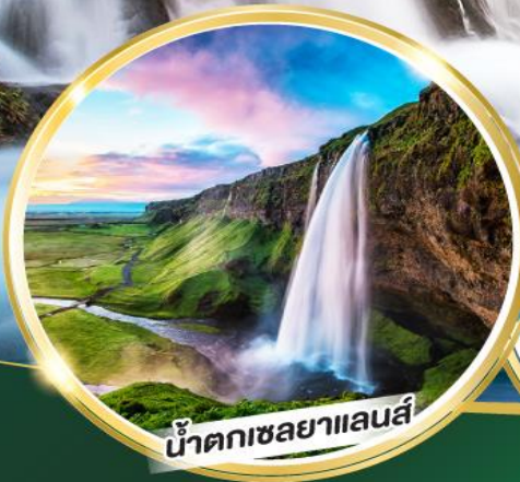
น้ำตกเซลยาแลนส์