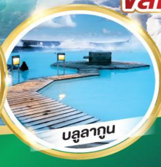
บลูลากูน