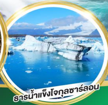
ธารน้ำแข็งโจกุลชาร์ลอน