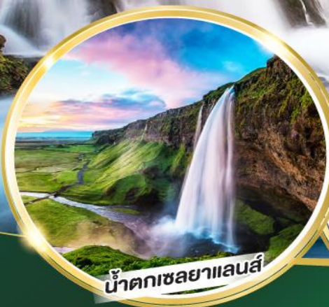
น้ำตกเซลยาแลนส์