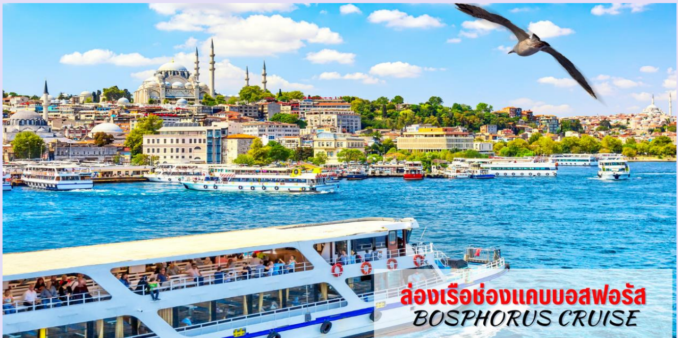
ล่องเรือชมช่องแคบบอสฟอรัส BOSPHORUS CRUISE

นำท่าน ล่องเรือชมช่องแคบบอสฟอรัส (Bosphorus Cruise) ช่องแคบที่เชื่อมทะเลดำ (The Black Sea) ทะเลมาร์มา (Sea Of Marmara) มีความยาวประมาณ 32 กม. ความกว้างตั้งแต่ 500 เมตรจนถึง 3 กิโลเมตร ซึ่งถือว่าเป็นที่สุดของยุโรปและเอเชียมาพบกันที่นี่ยังนอกจากความสวยงามแล้ว ช่องแคบบอสฟอรัสยังเป็นจุดยุทธศาสตร์ที่สำคัญยิ่งในการป้องกันประเทศตุรเคียอีกด้วย ขณะล่องเรือท่านจะได้เพลิดเพลินกับการชมวิวทัศนที่สวยงามทั้งสองข้างทางไม่ว่าจะเป็นพระราชวังโดลมาบาห์เซห์หรือบ้านเรือนสไตล์ยุโรปของบรรดาเศรษฐีตุรเคียและมีป้อมปืนตั้งเรียงราย