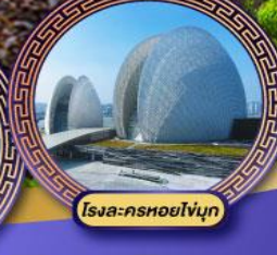
โรง-กรหอโงุ่น