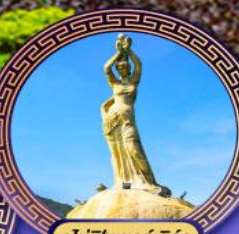
จูโห้ซอร์เก็ร