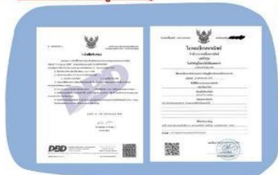
ตัวอย่างหนังสือจดทะเบียนบริษัท และ ใบทะเบียนพาณิชย์