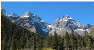
ภูเขาสี่ดรุณี