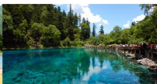
อุทยานแห่งชาติจิวจ้ายโก