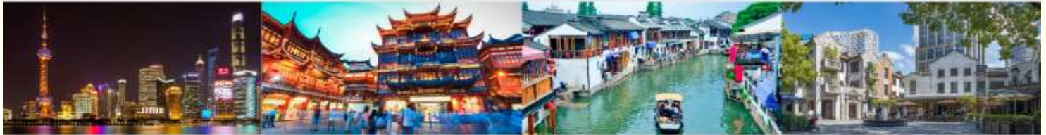
หาดไว่ทาน