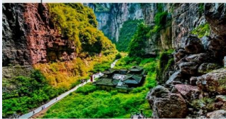
อุทยานแห่งชาติหลุมฟ้า 3 สะพานสวรรค์