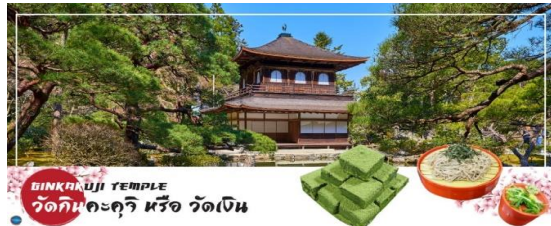
GINKAKUJI TEMPLE วัดกินคะคุจิ หรือ วัดเงิน

ทะเบียนกับองค์การยูเนสโกให้เป็นมรดกโลกด้านวัฒนธรรม ซึ่งวัดกินคะคุจิเป็นวัดนิกายเซน ถูกสร้างขึ้นโดยโชกุนอชิคากะ โยชิมาสะ หลานชายของท่านโชกุน ที่สร้างวัดคินคะคุจิ (Kinkakuji Temple) หรือที่รู้จักกันอย่างกว้างขวางว่าวัดทองสำหรับอาคารของวัดเงินสร้างขึ้นในรูปแบบเดียวกัน เพียงแต่จะไม่ได้มีสีทอง เป็นอาคาร 2 ชั้น และมีกฟืนกชอยู่บนหลังคา