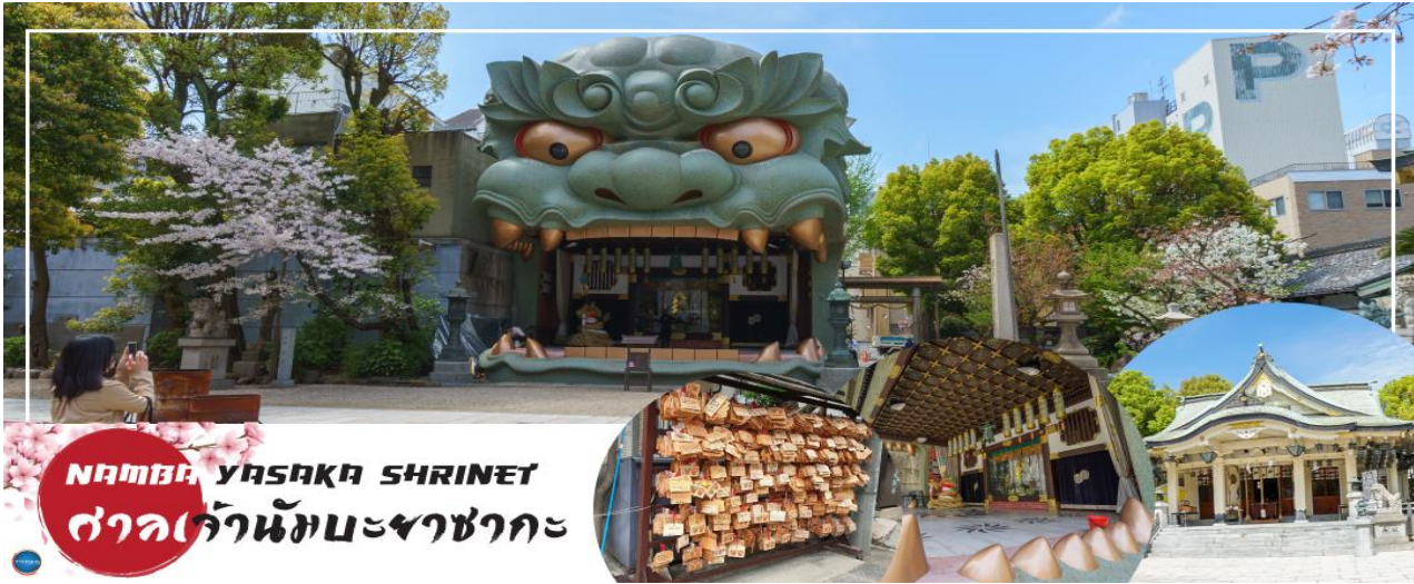
NAMBA YASAKA SHRINE ศาลเจ้านัมมะยะซากะ

วันที่ห้า เมืองโอซาก้า – ศาลเจ้านัมมะยะซากะ – ตลาดคูโรมง – ห้างอ็อน มอลล์ ริงกุเซนน – ท่าอากาศยานนานาชาติคันไซ – ท่าอากาศยานนานาชาติดอนเมือง