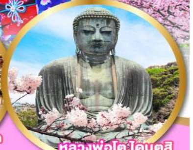
หลวงพ่อด"โคบุตสึ