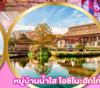
หมู่บ้านน้ำใส โอชิโนะอ๊กโก