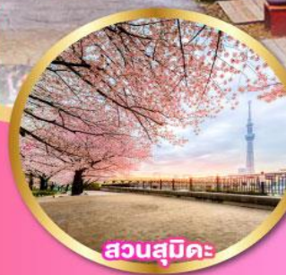
สวนสุมิดะ