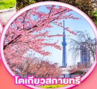
โตเกียวสกายทรี