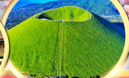
ภูเขาโอโมโระ