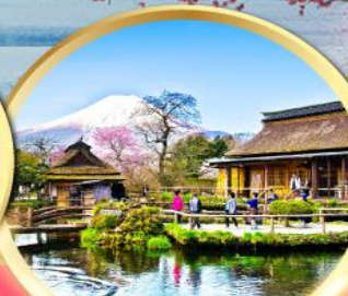
หมู่บ้านน้ำใสโอชิโนะฮักโก