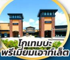
โทเทมบะ-พรีเมียมเอาท์เล็ต