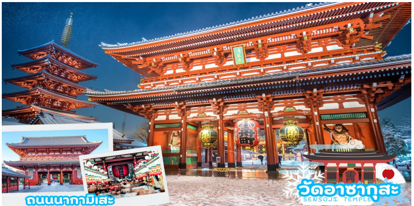
ถนนนากามิसे

นำท่านเข้าสู่ โตเกียว Tokyo คือ เมืองหลวงของประเทศญี่ปุ่น และเป็นหนึ่งใน 47 จังหวัดของประเทศญี่ปุ่น มีทำเลที่ตั้งอยู่บริเวณตอนกลางของประเทศ ทำให้เป็นเมืองที่มีสิ่งอำนวยความสะดวกครบครัน การคมนาคมที่สะดวกสบายมากๆ มีสถานที่ท่องเที่ยวที่หลากหลาย ไม่ว่าจะเป็นวัด สถานที่เที่ยวแบบธรรมชาติ แหล่งช้อปปิ้ง ร้านค้าและร้านอาหาร ย่านถนนคนเดินและอีกเพียบ