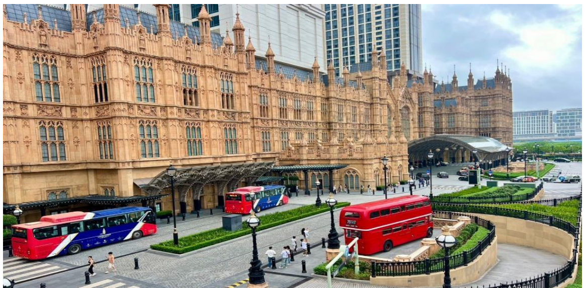
GO1MFM-NX012 มาเก๊า ช่องกง ดิสนีย์แลนด์ นองปิง เวนเซียน 4 วัน 2 คืน (รวมบัตรคิสนีย์) โดยสายการบิน Air Macau (NX)

นำท่านถ่ายภาพกับ ลอนดอนเนอร์ (The Londoner Macau) เป็นสถานที่ท่องเที่ยวอดนิมที่ตั้งอยู่ในมาเก๊า เป็นถนนที่จำลองสัญลักษณ์ที่สำคัญของเมืองลอนดอน ประเทศอังกฤษ อย่างเช่น บิ๊กเบน สะพานทาวเวอร์บริดจ์ และตู้โทรศัพท์สีแดง อิสระให้ท่านได้เพลิดเพลินกับการถ่ายรูป