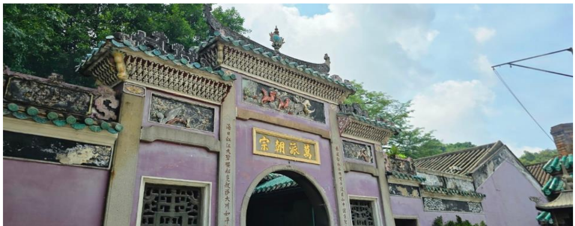
GO1MFM-NX012 มาเก๊า ช่องกง คิสนีแลนด์ นองปิง เวนเซียน 4 วัน 2 คืน (รวมบัตรคิสนี) โดยสายการบิน Air Macau (NX)

นำท่านเดินทางสู่ วัดอาม่า (A-Ma Temple) ให้ทุกท่านได้กราบไหว้เจ้าแม่ทับทิม ซึ่งเป็นวัดที่มีชื่อเสียงมากๆ สำหรับวัดแห่งนี้ตั้งอยู่ ใกล้กับทะเล ภายในวัดดูแล้วก็แปลกตาดีเพราะว่ามีการก่อสร้างกันแบบลัดหล่นกันไปตามพื้นที่ที่อานวย เนื่องจากสถานที่แห่งนี้ตั้งอยู่ริมเชิงเขา เมื่อเดินพันซุ่มประตูก็จะพบกับศาลของเจ้าแม่ทับทิมตั้งอยู่นอกจากนั้นก็ยังมี หอเมตตาธรรม ศาลเจ้าแม่กวนอิม ศาลพุทธเซ็นเจ้าชานหลินและยังมีศาลเจ้าขนาดเล็กๆ อีกหลายศาลที่ได้มีการสร้างเพื่อถวายให้แก่เจ้าแม่ทับทิม