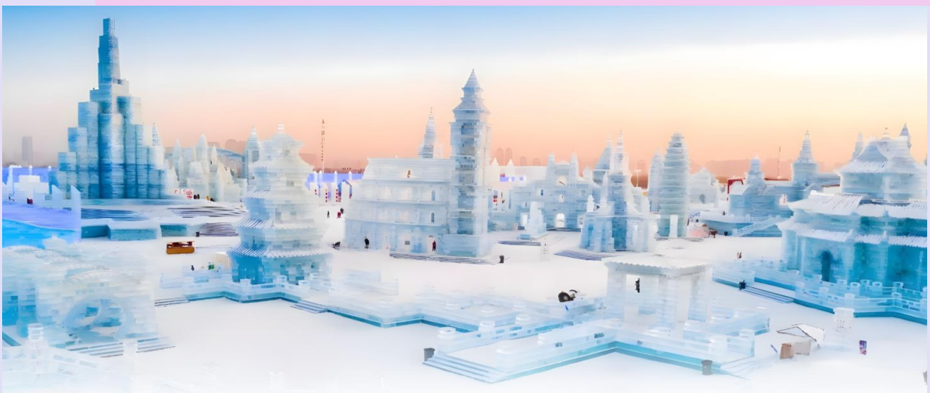
VHRB64XJ-37 ฮาร์บิน เทียวเพลิน คุ่มเกิน ราคา 4 คืน 3 ดาว BY XJ

Optional : ตกปลาน้ำแข็ง Jinyuan + ชมกีฬาน้ำแข็ง + เล่นห่วงยางลื่นหิมะ + หม้อไฟกระท่อมน้ำแข็ง (ค่า กิจกรรมท่านละ 260 หยวน สำหรับท่านที่สนใจ สามารถแจ้งความประสงค์ และสอบถามราคากับทางหัวหน้า ทัวร์อีกครั้ง)