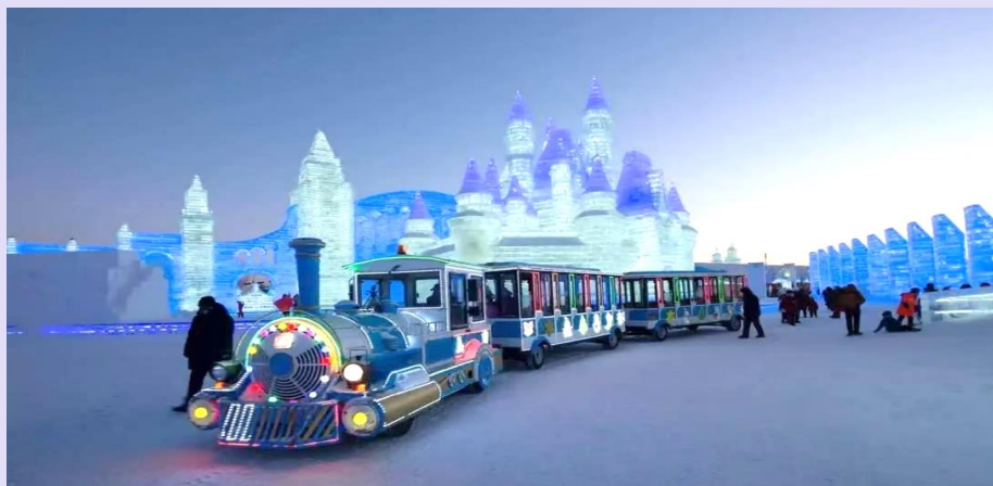
VHRB64XJ-37 ฮาร์บิน เทียวเพลิน คู่แม่เงิน ราคา 4 คืน 3 ดาว BY XJ

ภายในบริเวณงาน Harbin International Ice and Snow Festival มีรถไฟบริการ ท่านละประมาณ 50 หยวน ทั้งนี้โปรดสอบถามราคาและบริการอีกครั้ง เนื่องจากในแต่ละปีเงื่อนไขการให้บริการต่างกันออกไป