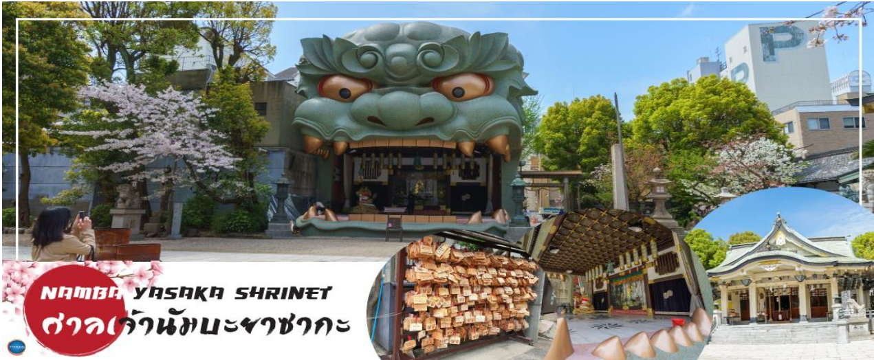
NAMBA YASAKA SHRINE ศาลเจ้านัมมะยาซากะ

วันที่ห้า เมืองโอซาก้า – ศาลเจ้านัมมะยาซากะ – ตลาดคูโรมง – ห้างอโชน มอลล์ ริงกุเซ็น – ท่าอากาศยานนานาชาติคันไซ – ท่าอากาศยานนานาชาติดอนเมือง