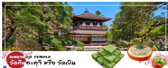
GINKAKUJI TEMPLE วัดกินคะคุจิ หรือ วัดเงิน

ประมาณ 15 นาที) เป็นอีกหนึ่งในสถานที่ที่ขึ้นทะเบียนกับองค์การยูเนสโกให้เป็นมรดกโลกด้านวัฒนธรรม ซึ่งวัดกินคะคุจิเป็นวัดนิกายเซน ถูกสร้างขึ้นโดยโชกุนอชิคากะ โยชิมาสะ หลานชายของท่านโชกุน ที่สร้างวัดกินคะคุจิ (Kinkakuji Temple) หรือที่รู้จักกันอย่างกว้างขวางว่าวัดทองสำหรับอาคารของวัดเงินสร้างขึ้นในรูปแบบเดียวกัน เพียงแต่จะไม่ได้มีสีทอง เป็นอาคาร 2 ชั้น และมีนกฟีนิกซ์อยู่บนหลังคา