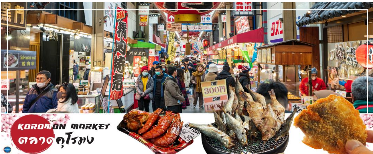
KUROMON MARKET ตลาดคูโรมง

จากนั้นนำท่านเดินทางสู่ ตลาดคูโรมง โอซาก้า (Kuromon Ichiba Market) เป็นตลาดที่มีชื่อเสียงและเก่าแก่มากที่สุดแห่งหนึ่งของเมืองโอซาก้า บรรยากาศภายในเป็นทางเดิน Arcade เล็กๆ ทอดยาวประมาณ 600 เมตร 2 ข้างทางจะเต็มไปด้วยร้านค้าต่างๆกว่า 160 ร้านค้าขายทั้งของสด และแบบพร้อมทาน มีของกินเล่นและอาหารพื้นเมืองมากมายหลายชนิดให้ได้ชิมกัน