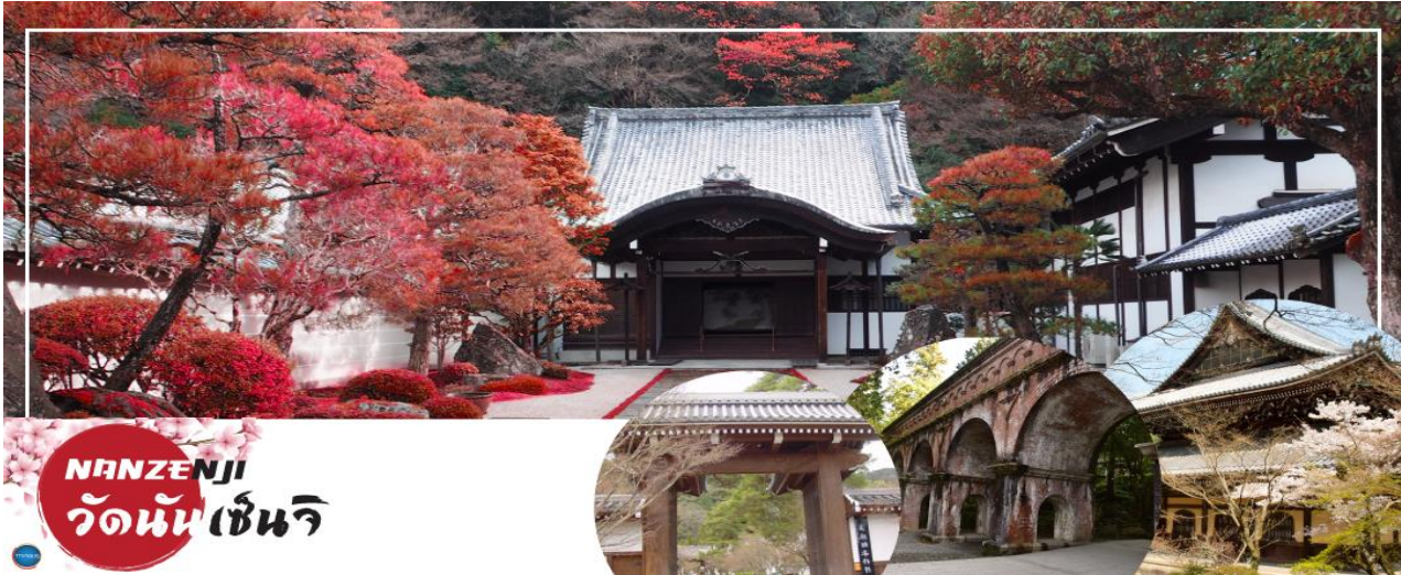
NANZENJI วัดนันเซ็นจิ

วันที่สาม เมืองโอซาก้า – เมืองเกียวโต – วัดนันเซ็นจิ – การเรียนพิธีชงชาญี่ปุ่น – วัดกินคะคุจิ หรือ วัดเงิน – ถนนสายนักปราชญ์ – เมืองโอซาก้า – ซ้อปิ้งชินไซบาชิ