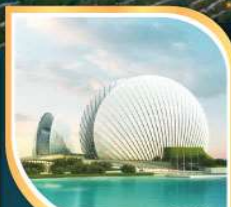
โรงละครหอยโข่งนุก