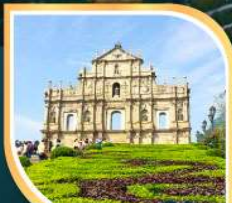
วิหารเซนต์ปอล