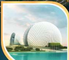
โรงละครหอยไข่มุก