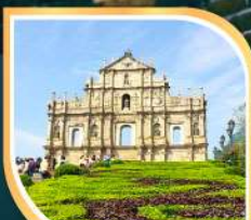
วิหารเซนต์ปอล