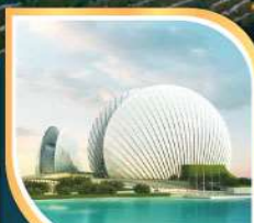
โรงละครหยงโข่ง