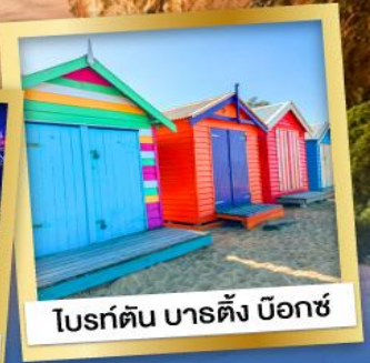
โบรด์ตัน บาร์ตัง บ็อกซ์