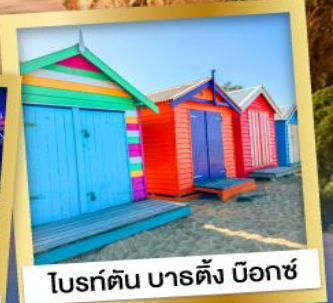
โบรด์ตัน บาร์ตัง บ็อกซ์