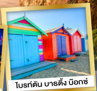
โบรด์ตัน บาร์ตัง บ็อกซ์