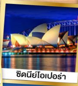
ซิดนีย์โอปอรา