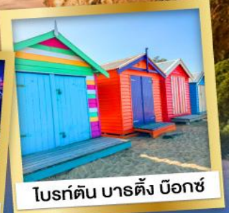
โบรด์ตัน บาร์ตัง บ็อกซ์