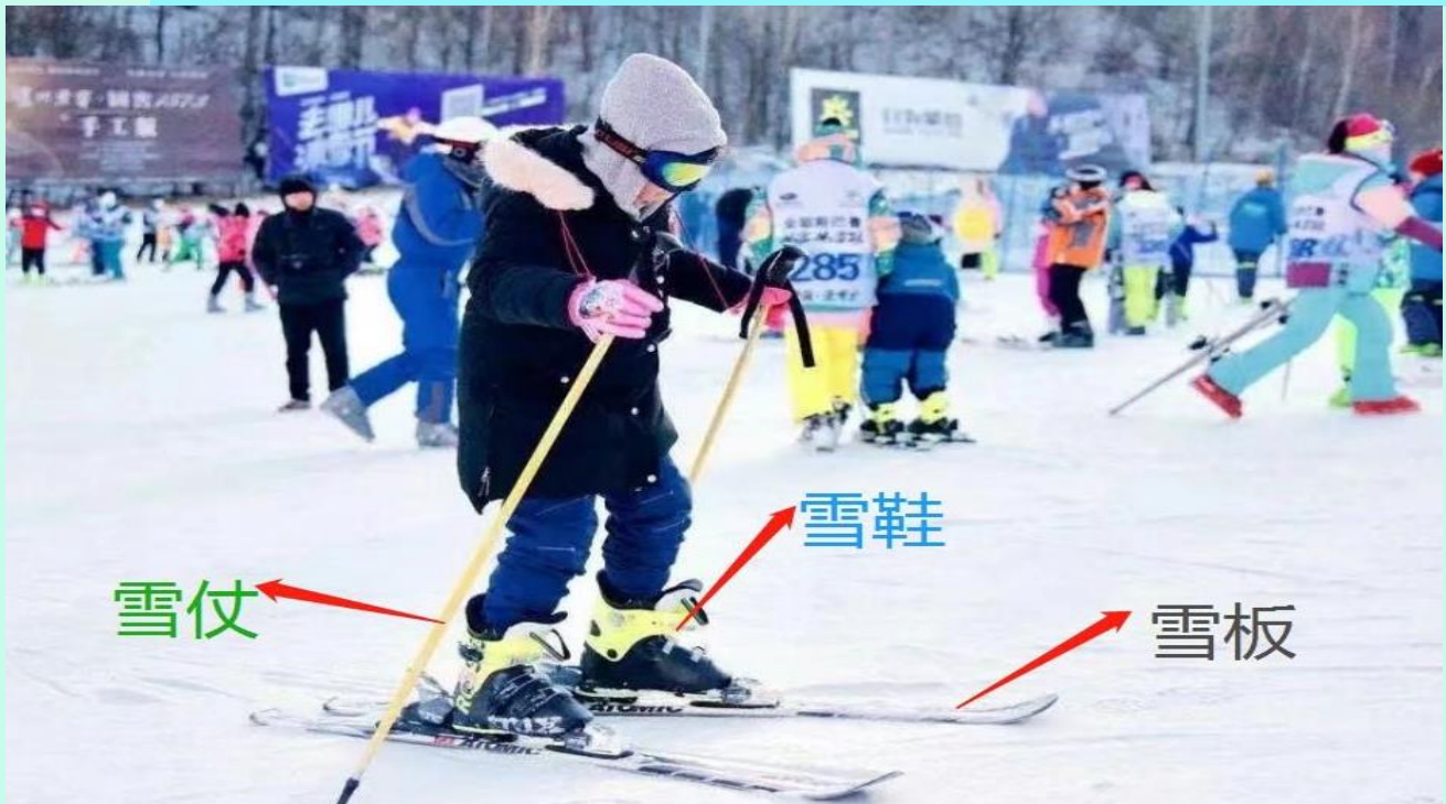
VHRB75XJ-36 ฮาร์บิน บินตรง เทียวคัม จัดเต็ม 5 คืน 3 ดาว BY XJ

Optional : อุปกรณ์การเล่นสกี (รองเท้า+กระดานสกี+ไม้ค้ำ) (ค่าเช่าอุปกรณ์สกีท่านละ 260 หยวน สามารถใช้ได้ 3 ชั่วโมง สำหรับท่านที่สนใจ สามารถแจ้งความประสงค์ และสอบถามราคากับทางหัวหน้าทัวร์อีกครั้ง)