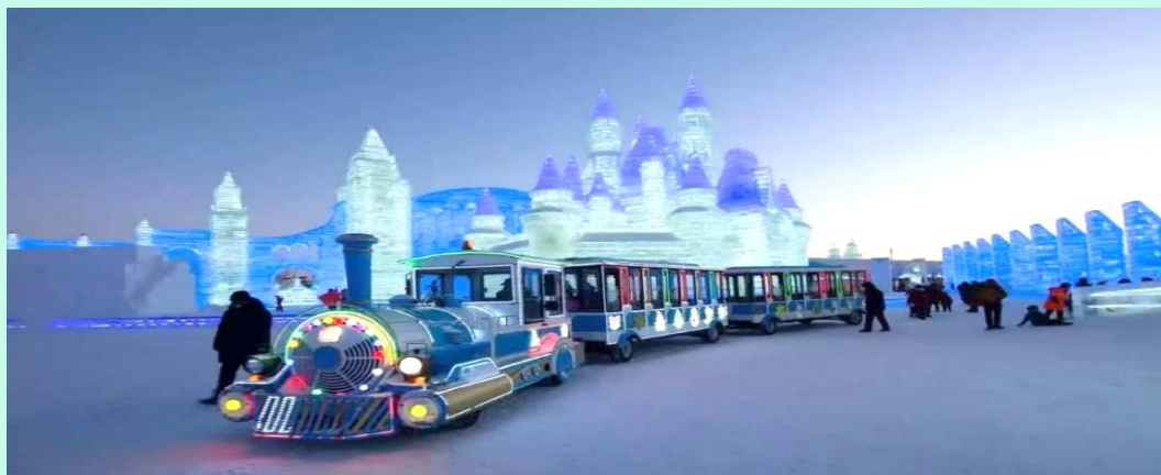
VHRB75XJ-36 ฮาร์บิน บินตรง เทียวคัม จัดเต็ม 5 คืน 3 ดาว BY XJ

ภายในบริเวณงาน Harbin International Ice and Snow Festival มีรถไฟฟ้าบริการ ท่านละประมาณ 50 หยวน ทั้งนี้โปรดสอบถามราคาและบริการอีกครั้ง เนื่องจากในแต่ละปีเงื่อนไขการให้บริการต่างกันออกไป