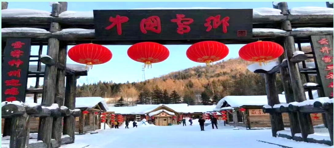
VHRB75XJ-36 ฮาร์บิน บินตรง เที่ยวคุ้ม จัดเต็ม 5 คืน 3 ดาว BY XJ

(หมายเหตุ : ปริมาณของหิมะ และความหนาแน่นของหิมะนั้น ขึ้นอยู่กับสภาพอากาศในแต่ละปี หากสภาพอากาศไม่เอื้ออำนวยส่งผลให้หิมะละลาย ทางบริษัทขอสงวนสิทธิ์ ไม่คืนค่าใช้จ่ายทุกกรณี เนื่องจากอยู่นอกเหนือความควบคุมของบริษัท)