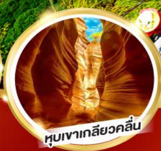
หุบเขาเกลียวคลื่น