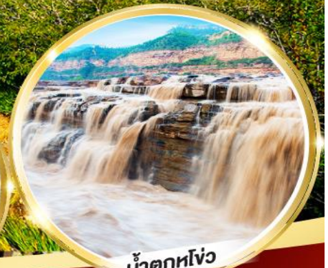
น้ำตกหูโจว